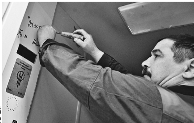
Информационные доски — это вчерашний день