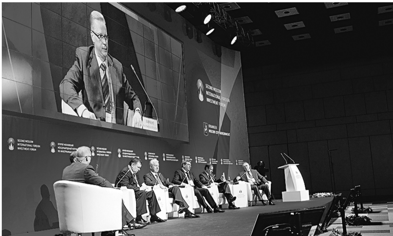
23 октября 11.15 На первой сессии форума участники обсудили инвестиционный климат России