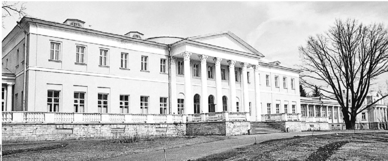
Усадьба Остафьево «Русский Парнас» — гордость Новой Москвы. Это единственный в ТиНАО музей федерального значения

Экскурсанты посетят в Переделкине (поселение Внуковское) библиотеку Корнея Чуковского, которую писатель построил на свои деньги в 1957 году. Это был финский домик с несколькими комнатами, он строил не просто хранилище книг, а дом для детей. Дети прибегали сюда прямо из школы, делали уроки, играли в шашки и шахматы. Побывают экскурсанты в усадьбе Валуево (поселение Московский), основанной еще в XIV веке. В разное время усадьбу