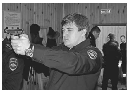
Победители были награждены дипломами, кубками и медалями.

■ Пресс-служба ОМВД России по Солнечногорскому району