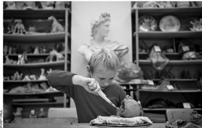
Юный ученик мастерит поделку из глины во Дворце детей и юношества на Воробьевых горах

В минувшую пятницу в Минобрнауки прошло обсуждение развития дообразования школьников. В развитие кружков вложат десятки миллиардов. В Министерстве образования и науки РФ состоялся первый межведомственный совет по дополнительному образованию и воспитанию детей. Тема обсуждалась острая — развитие детских кружков. По словам руководителя Минобрнауки Дмитрия Ливанова, Россия — одна из немногих стран, где система образования детей финансируется государственным бюджетом, и это наше огромное преимущество. Он отметил, что двигаться вперед мы должны с опорой на традиции. — Важно модернизировать нашу систему дополнительного образования — сделать