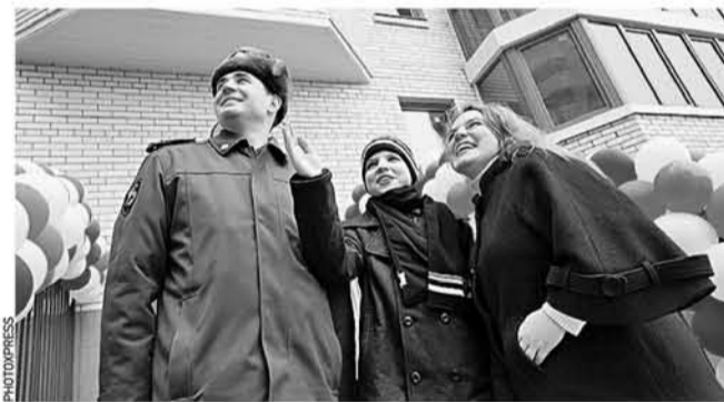
Для людей в форме новоселье — особенная радость