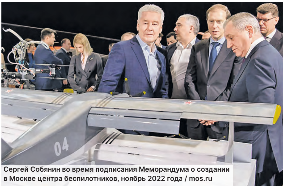
Сергей Собянин во время подписания Меморандума о создании в Москве центра беспилотников, ноябрь 2022 года

■ Резиденты особой экономической зоны (ОЭЗ) «Технополис Москва» производят роботов для работы в самых разных условиях.