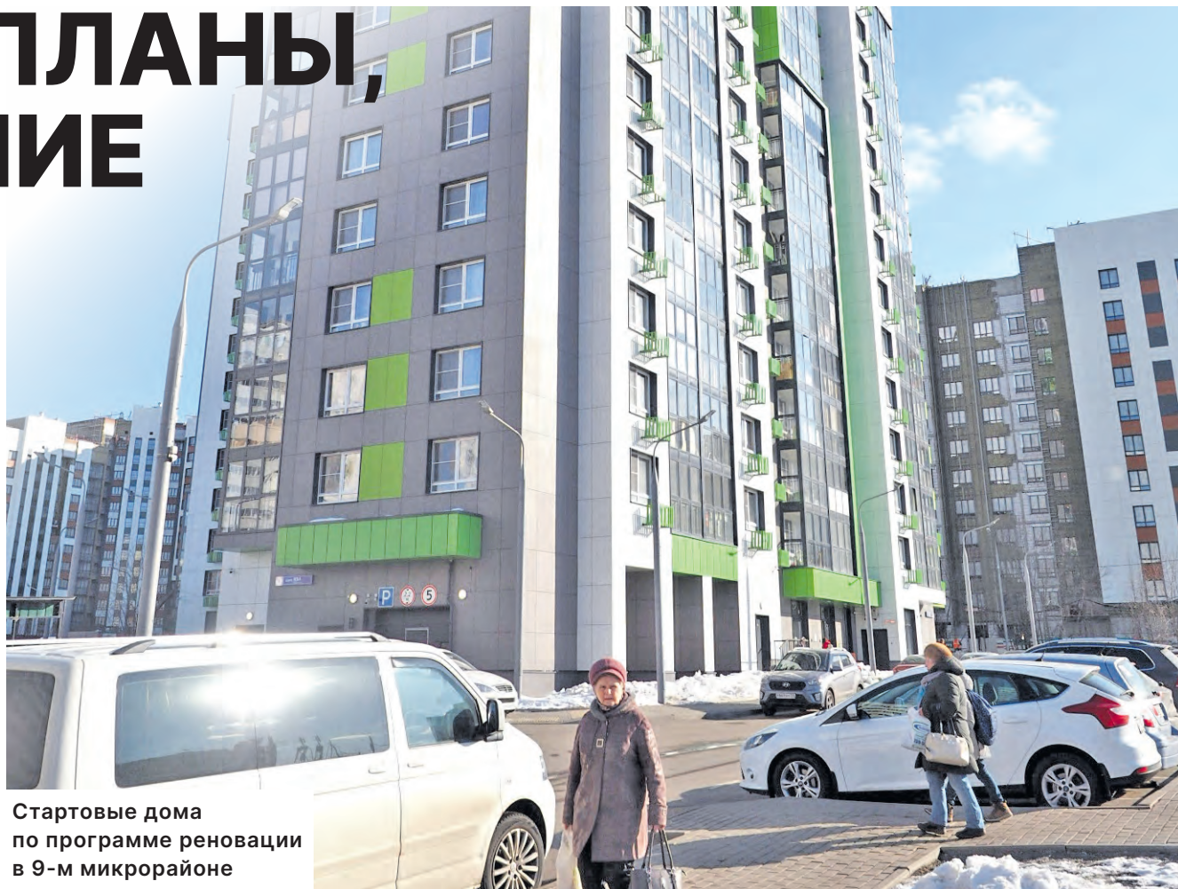
Стартовые дома по программе реновации в 9-м микрорайоне

Напомним, что в программе реновации в Зеленограде включены 34 дома. В основном это 19-й микрорайон, квартал домов постройки 1950-х годов возле станции Крюково. Микрорайон будет полностью перестроен. Также есть несколько домов в 18, 9 и 10-м микрорайонах, причем в одном из домов по ул. Гоголя (10-й мкрн) пока что располагается зеленоградский историко-краеведческий музей, который переедет в знаменитую «Флейту» – корп. 360.