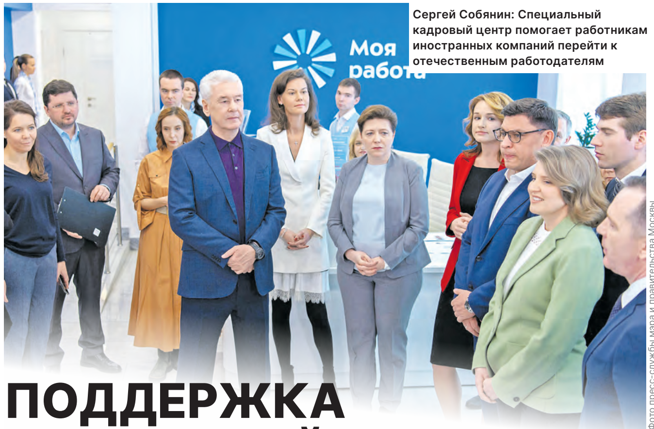
Сергей Собянин: Специальный кадровый центр помогает работникам иностранных компаний перейти к отечественным работодателям

В этой сфере на федеральном и городском уровне приняты революционные решения. Максимально упрощены процедуры разработки и согласования градостроительной и строительной документации и предоставления земельных участков, находящихся в государственной собственности. На год сохраняются текущие ставки арендной платы за земельные участки, предоставленные для целей строительства. Застройщики получают бес-