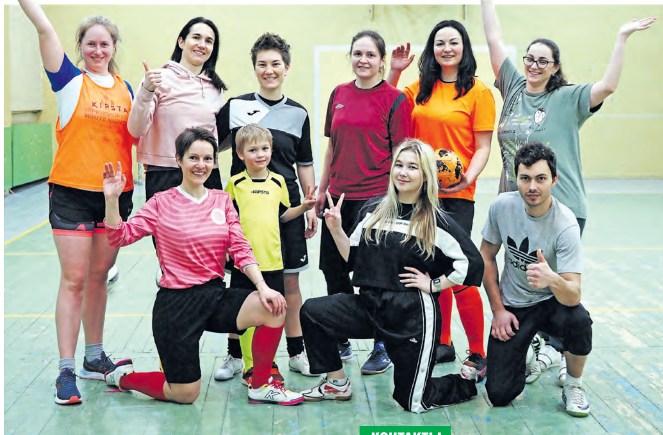
Участницы женского ФК Зеленограда с друзьями команды

– Нужен баланс! – считают участницы ФК. – Абсолютно