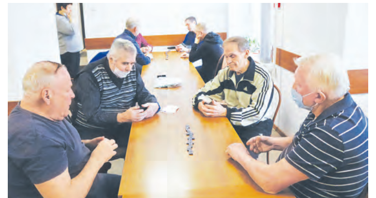
Вокруг домино – нешуточные страсти

■ По 12 видам спорта в районе Крюково проходят спартакиады «Спортивное долголетие». В этом году – уже XII по счету.