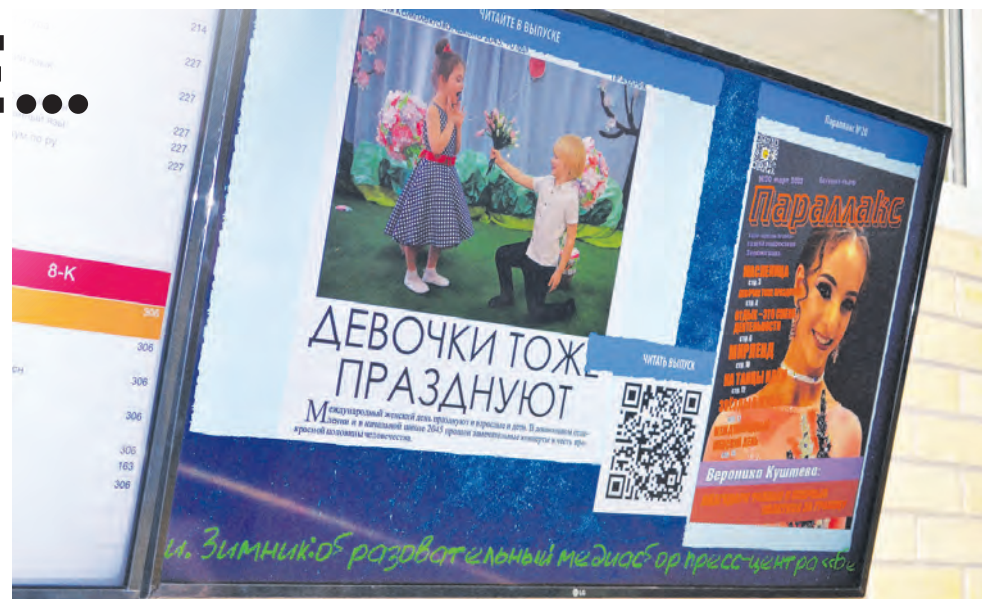
Информационный экран на стене школы №2045

– Похвала дома, в своем классе, в своей школе, в своем дворе стоит очень