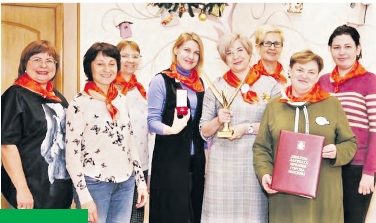
Коллектив ЦПСид, лауреат премии Москвы «Крылья аиста» 2019 года

ми могут столкнуться родители, и помогают им оценить ответственность, а также научиться быть более восприимчивыми к чувствам и реакциям ребенка.