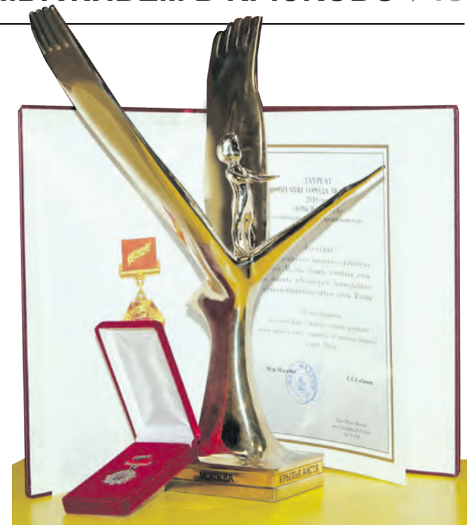
Приз «Крылья аиста»

слушатели с первых же дней обучения активно включаются в работу: задают вопросы, с интересом выполняют практические упражнения, участвуют в обсуждениях, высказывая свое мнение, делятся опытом друг с другом. На протяжении всего обучения в Школе осуществляется методическая поддержка слушателей. Им предоставляются ссылки на вебинары, тематические статьи, брошюры и методички, которые отражают важные знания и механизмы взаимодействия после приема детей в семью. На заключительном этапе проводится итоговая аттестация в форме