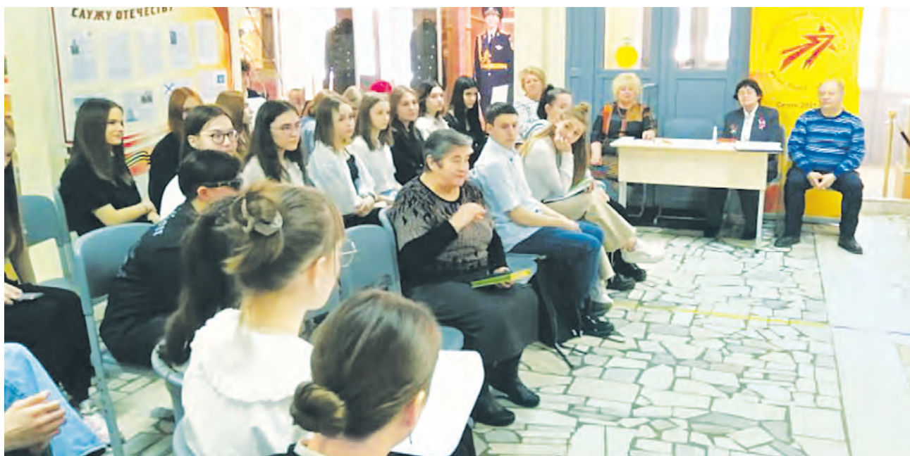
Идет демонстрация работ учеников медиаклассов