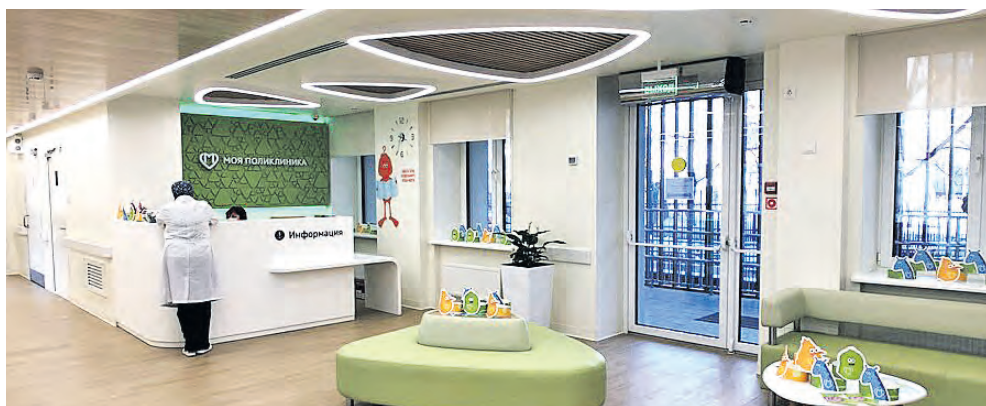
Так выглядят столичные учреждения здравоохранения после реконструкции

■ Капитальный ремонт в филиале поликлиники №5 ГКБ имени М.П. Кончаловского выполнен на 60%. Основные строительные-монтажные работы планируется завершить в третьем квартале этого года.