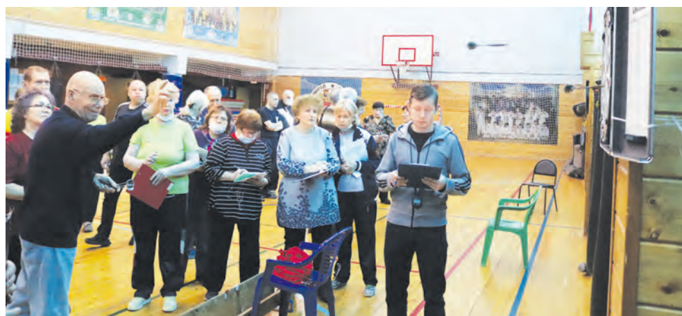
Соревнования по дартсу – для всех возрастов

Иван ЛАЗАРЕВИЧ