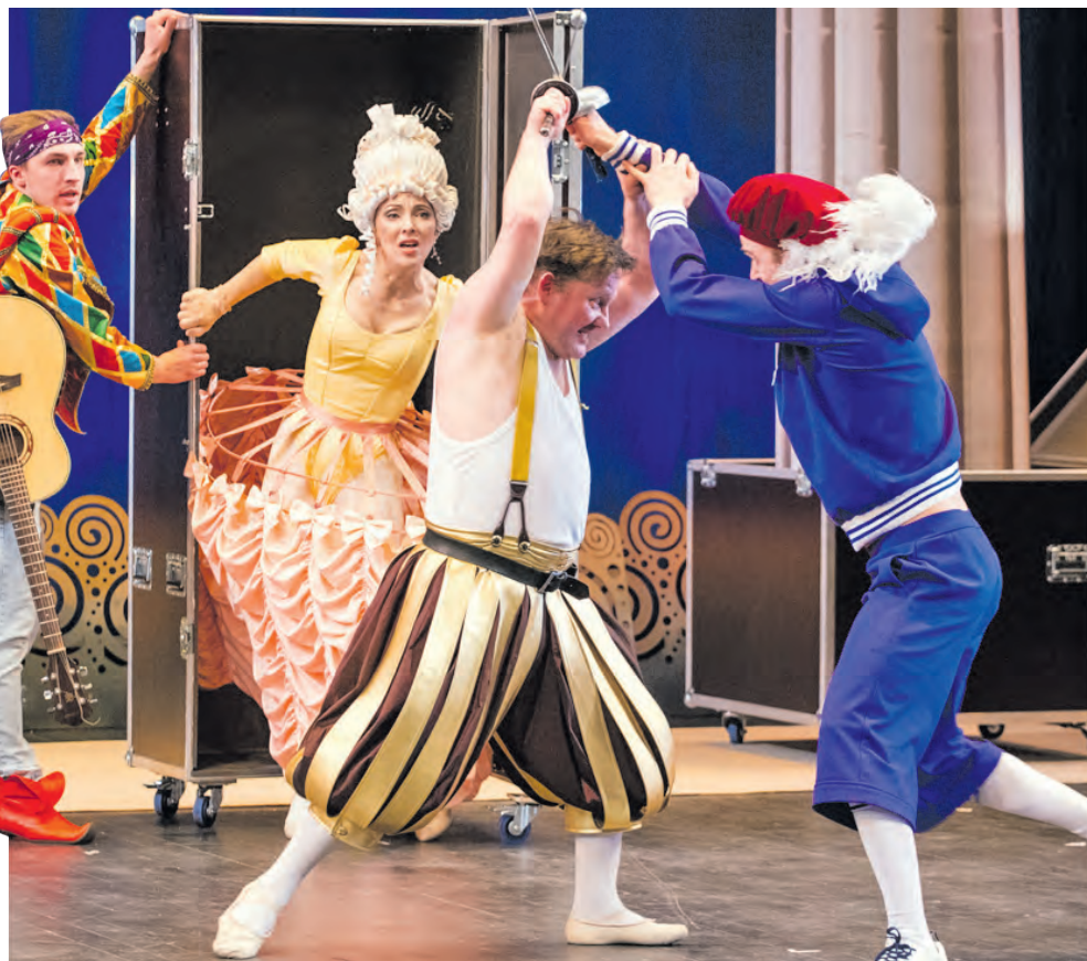
«Ведогонь-театр», сцена из спектакля «Двенадцатая ночь»

Во время реконструкции «Ведогонь-театр» давал свои спектакли на сцене КЦ «Зеленоград» и в прошлом году наконец-то справил новоселье. Это был большой праздник для всего Зеленограда. По зданию даже проводятся экскурсии, пользующиеся большим спросом. И театр не разочаровывает своих поклонников. Новые и прежние постановки привлекают большое количество любителей театрального искусства. На этой неделе труппа под руководством Павла Курочкина дала уже вторую премьеру на новой сцене.