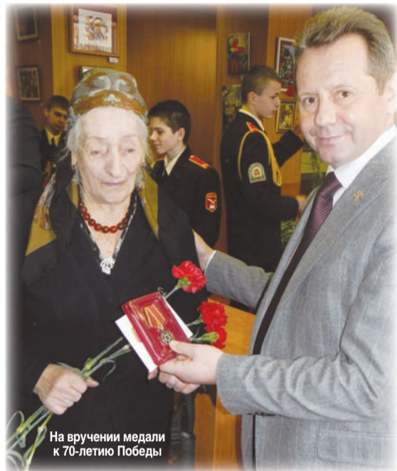
На вручении медали к 70-летию Победы

ей удавалось собрать ценную информацию и передать ее на родину.