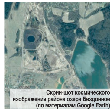
Скрин-шот космического изображения района озера Бездонное (по материалам Google Earth)

из верхней части земной коры. Это очень необычная версия, но ей противоречит отсутствие вокруг озера «бруствера» из выброшенной породы. Ведь вокруг озера произрастает плотная древесная, в основном