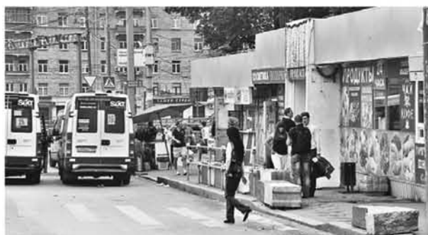
Скопище киосков почему-то признали капитальным строением