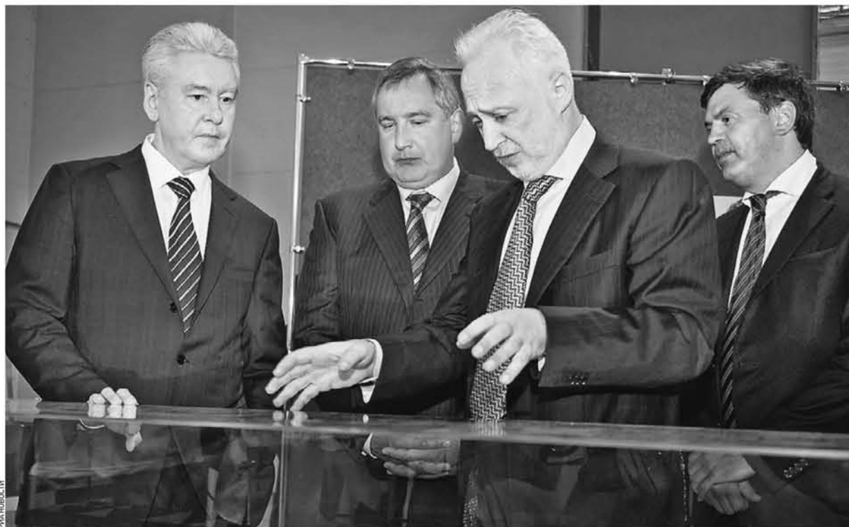
6 августа 15.14 Врио мэра Сергей Собянин (слева) и вице-премьер Дмитрий Рогозин (в центре) обсудили развитие промышленности в столице и кадровый резерв