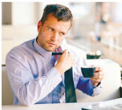
БАНК «ВОЗРОЖДЕНИЕ» (ОАО)