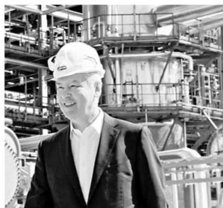
17 июля 2013 года Сергей Собянин во время посещения Московского нефтеперерабатывающего завода отметил, что переход на производство топлива стандарта Евро-5 сократит вредные выбросы в десятки раз

— Обычные, стандартные платежи составляли бы около семи миллиардов рублей, что не позволило бы проводить реконструкцию, — пояснил Сергей Собянин. — Мы пошли навстречу, освободили их полностью от платежей за аренду. Таким