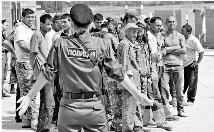
Совместный рейд УФМС и полиции в очередной раз выявил тот факт, что на стройках в подавляющем большинстве трудятся нелегальные мигранты