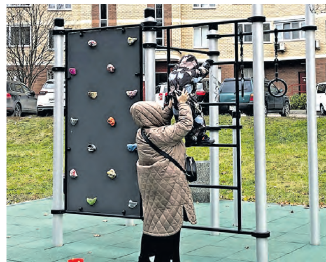
Во дворе корпуса 119 обустроили уютную детскую площадку и отремонтировали спортивную.

Дополнительно вокруг пруда отремонтировали проезды и дорожки, заменили детскую площадку. Пока у Быкова болота отсутствует большая