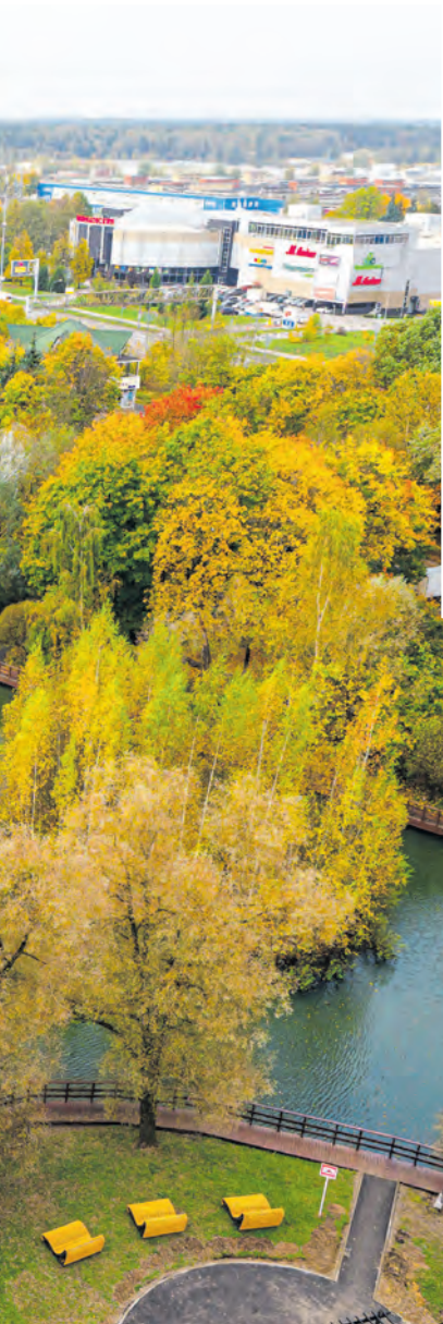
В 2024 году зона отдыха Быкова болота в 1-м микрорайоне была реконструирована, а сам водоем – очищен.

тального ремонта Москвы. В корпусе 200Б заменены мусоропровод, система электропитания, стояки горячего и холодного водоснабжения, канализации. Сегодня завершается капитальный ремонт подъездов. Внутри подъездов работают и в корпусе 145. В доме 4 на площади Юности заменили пожарный водопровод, канализацию и отремонтировали кровлю. А в соседнем доме 5 капитально обновляют подъезды – ранее здесь отремонтировали стояки канализации.