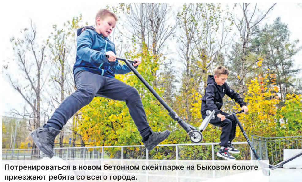
Потренироваться в новом бетонном скейтпарке на Быковом болоте приезжают ребята со всего города.

Евгений АНДРЕЕВ, опрос провел Артем КАБАНОВ