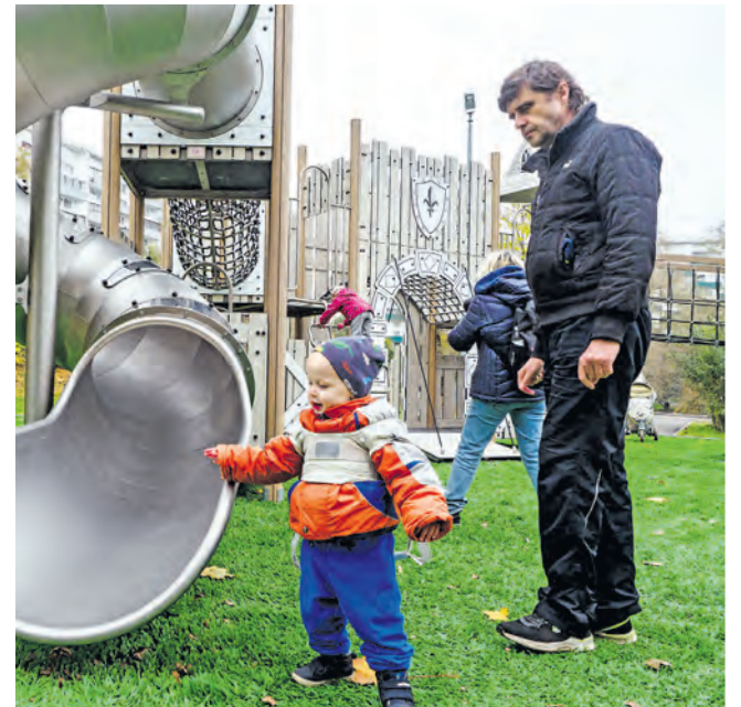
Отдыхать на Быковом болоте можно всей семьей – найдутся занятия и для детей, и для взрослых.

В прошлом году в Матушкино закончен капитальный ремонт поликлинического