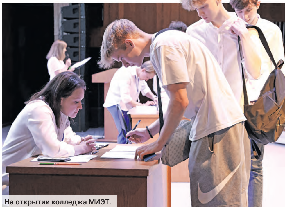
На открытии колледжа МИЭТ.

На неделе я провел очередное заседание Совета директоров организаций науки и промышленности Зеленограда. Неудивительно, что все докладчики так или иначе затрагивали тему подготовки кадров среднего звена.