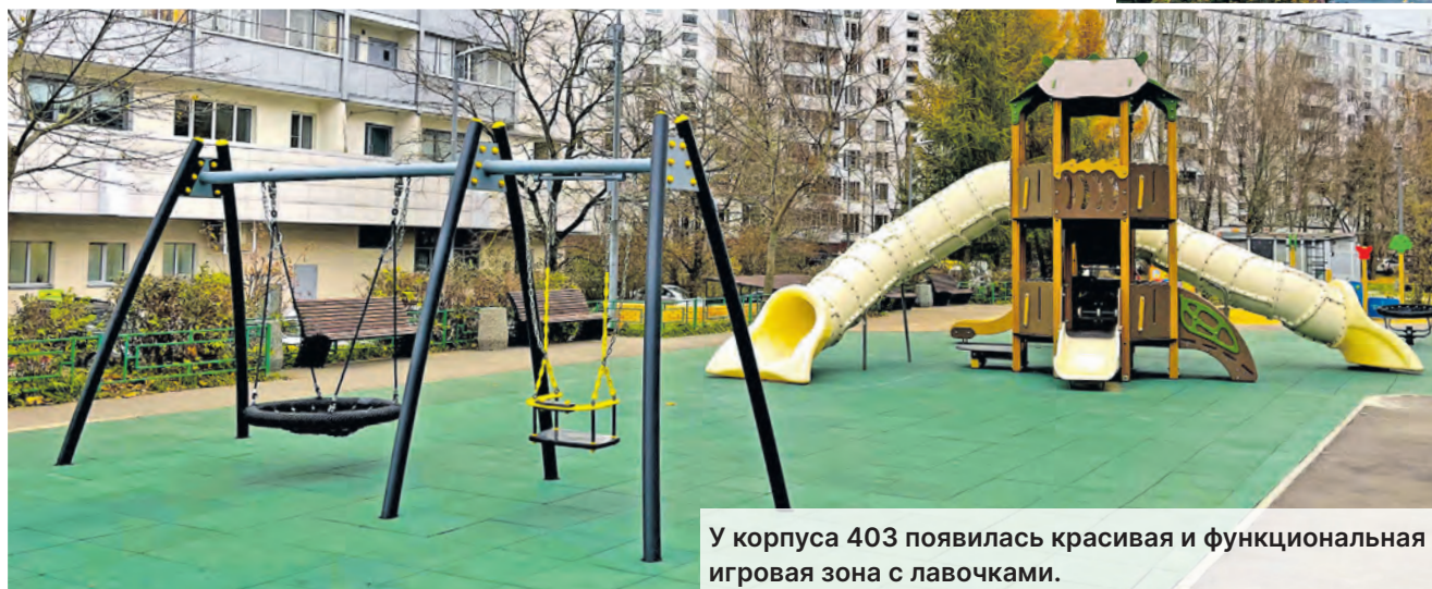
У корпуса 403 появилась красивая и функциональная игровая зона с лавочками.

Вокруг водоема возведен новый деревянный настил со скамейками и урнами. Обустроена зона тихого отдыха с дорожками и спусками.