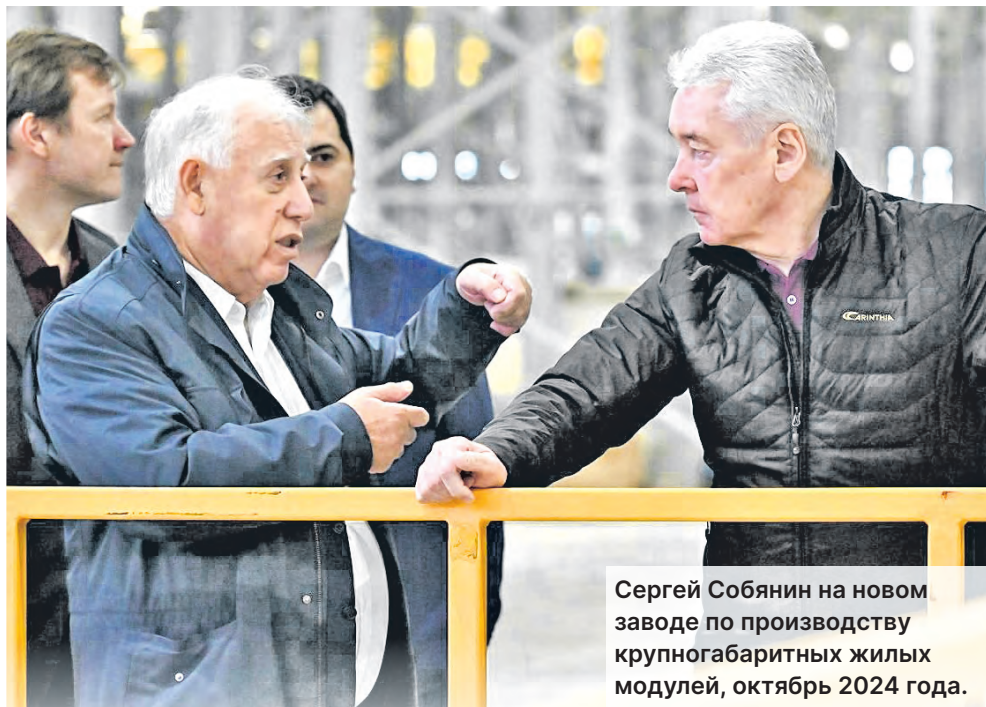
Сергей Собянин на новом заводе по производству крупногабаритных жилых модулей, октябрь 2024 года.