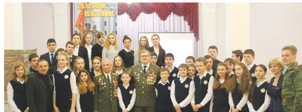
Встреча на вечере памяти

Встречи воинов-интернационалистов с учащимися солнечногорских школ, посвященные 27-й годовщине вывода советских войск из Афганистана, прошли в ГЦНТИД «Лепсе».