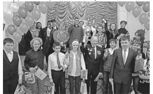
Е.МИШИНА, фото автора

Управление Федеральной миграционной службы России Московской области по Солнечногорскому району совместно с районным Комитетом по делам молодежи, спорту и туризму продолжает славную традицию торжественного вручения паспортов юным гражданам страны.