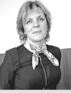
С.В., фото автора

Если позволит погода, 26 апреля планируется проведение акции по посадке деревьев во дворах силами жителей.