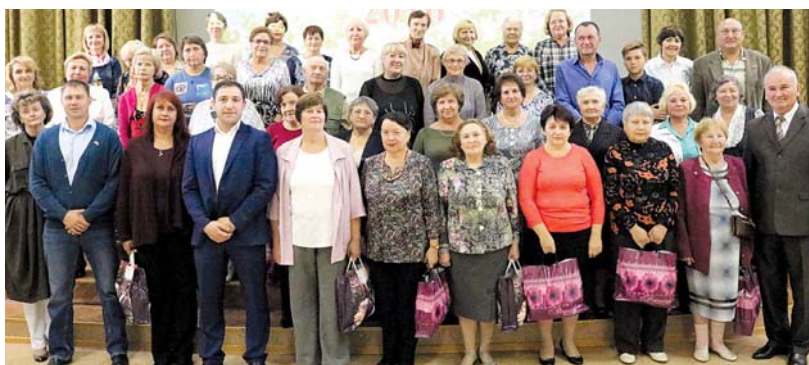
Участники конкурса «Цветочная симфония Крюково»

Мероприятие было подготовлено аппаратом Совета депутатов