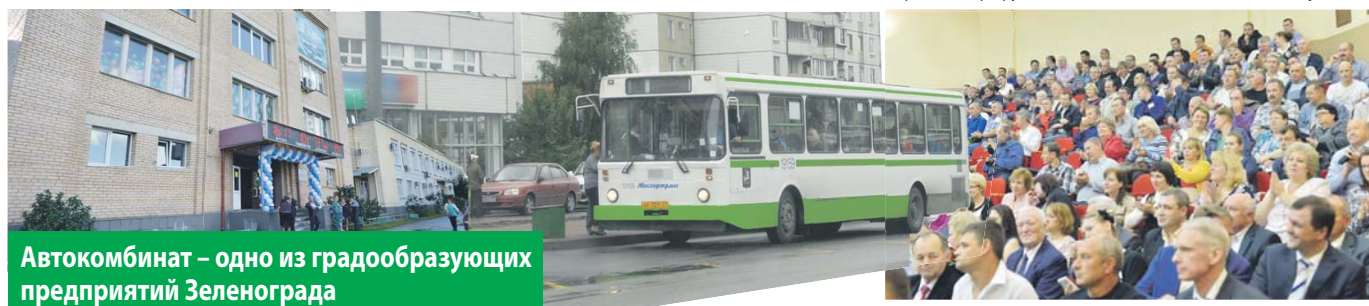
Автокомбинат – одно из градообразующих предприятий Зеленограда