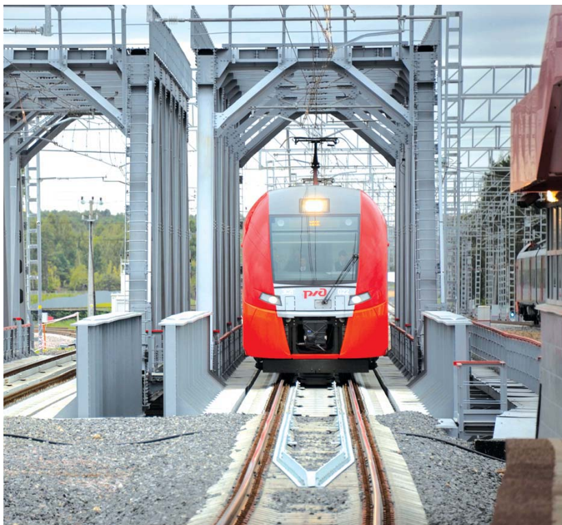
Поезд уходит со станции Лихоборы в сторону Окружной

Электричка на 08.38 (следующая – 08.56, предыдущая – 07.41: первое впечатление – маловато будет!) из Твери со всеми остановками кроме Фирсановской. Очевидно, что это один из четырех поездов, которому добавлена остановка на платформе НАТИ, потому что остановку объявляет машинист, вмешиваясь в размеренную записанную речь диктора. Народу много, но не битком – сидячие места есть.