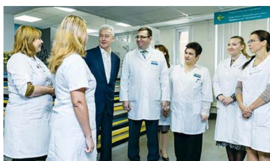
Встреча мэра с персоналом поликлиники