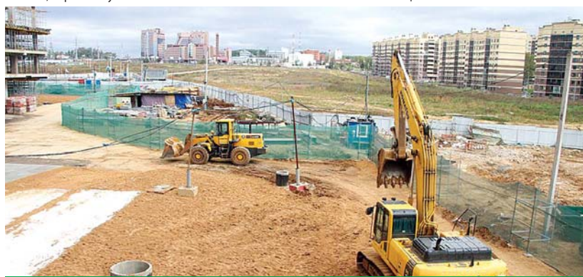
Стройплощадка Префектуры ТиНАО