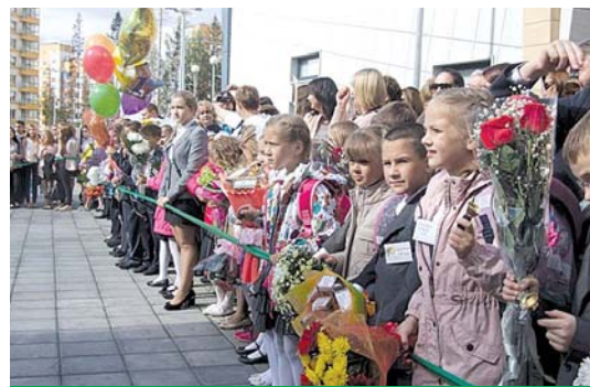
Начало нового учебного года