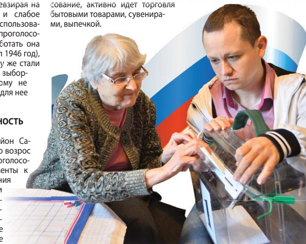
Для маломобильных людей – выборы на дому

В школах, где проходило голосование, активно идет торговля бытовыми товарами, сувенирами, выпечкой.