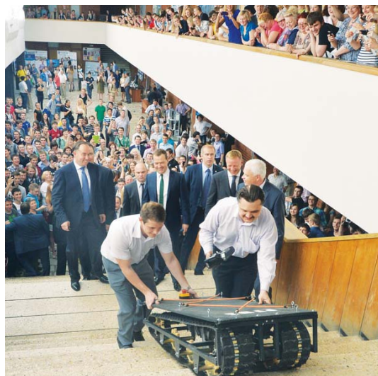
Премьер-министр РФ Д.Медведев на демонстрации инновационных разработок в МИЭТ

В будущем году эту методику по заказу Правительства Москвы научный парк МГУ поможет запустить и в других столичных технопарках.