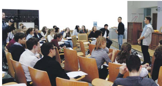
Сотрудники собрались большой семьей

ределить свое призвание. Встреча посвящалась развитию проектной деятельности среди учеников. Руководитель центра Е.Должkevич рассказал лицеистам о том, из каких этапов состоит путь от идеи до ее реализации.