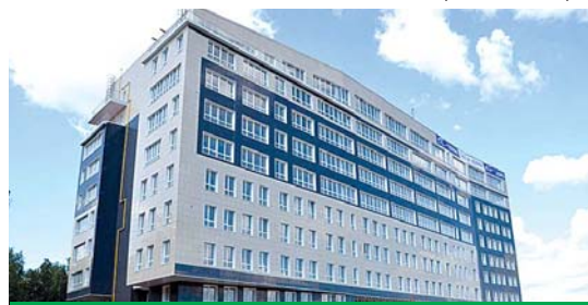
«Высота» даст 1500 новых рабочих мест

Открыты пункты, обслуживающие 19 поселений Новой Москвы, в которых ведется при-