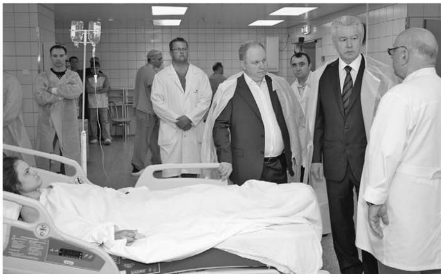
13 июля 2013 года. Врио мэра Сергей Собянин посещает пострадавших в аварии под Подольском, которых перевезли в Институт скорой помощи имени Склифосовского