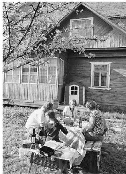
Дача для многих — постоянное место жительства