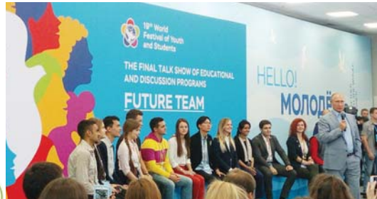
На встрече участников фестиваля с президентом В.Путиным

Формат дискуссий помог спикерам и участникам из разных стран емко и насыщенно обсудить поднимаемые темы, дать советы, ответить на вопросы. А конкретно: каждый день с 7 утра до 2 ночи мы были постоянно