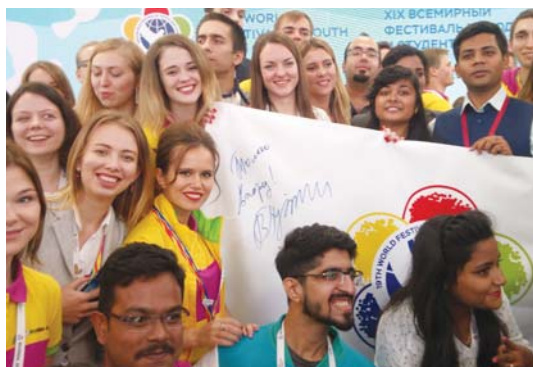
Напутственное слово от президента: «Только вперед!»

Организаторы каждого направления подготовили встречи с потрясающими спикерами: С.Лавровым, Г.Грефом, А.Вассерманом, М.Захаровой, Н.Вуйичем, представителями Google, IT-сферы, Сбербанка, Ростелекома, знаменитыми спортсменами А.Кабаевой, Е.Исинбаевой, топовыми дизайнерами и архитекторами из ОАЭ, Италии и др.