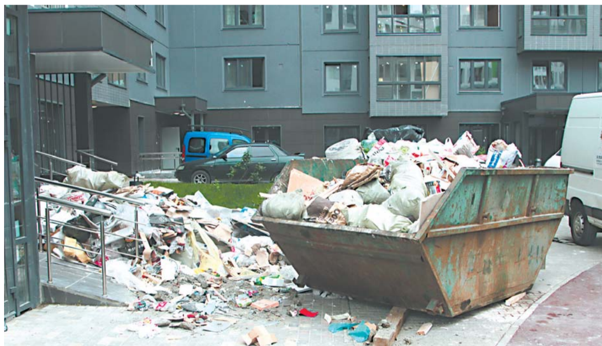
■ От жителей поступает много нареканий и жалоб, в основном на уборку территорий и вывоз мусора.

Мы сообща составили план действий, в соответствии с которым специалисты префектуры, управы района, жилищной инспекции будут оказывать управляющей компании максимальную помощь в оформлении документов, а также в вопросах организации повседневной работы. Многие проблемы возникают, очевидно, потому, что именно у того отделения «ПИК-комфорт», которое отвечает за работу в нашем микрорайоне, просто недостаточно опыта. Плохо, конечно, что это привело к неудобствам для жителей, но сейчас к делу подключились