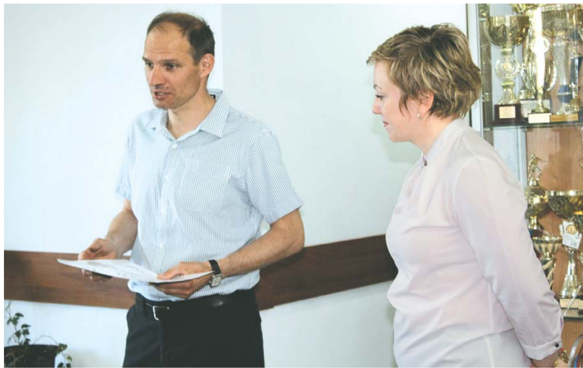
■ Главное – держать ритм, а там пойдет, – объясняет тренер по теннису.