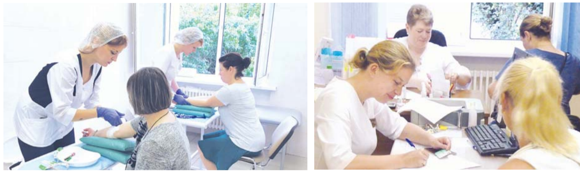
■ Выявление онкологических заболеваний на ранних стадиях позволяет увеличить эффективность лечения.

Обследование прошли 258 человек, из них 196 – женщины. Результаты будут готовы в течение 30-45 дней.