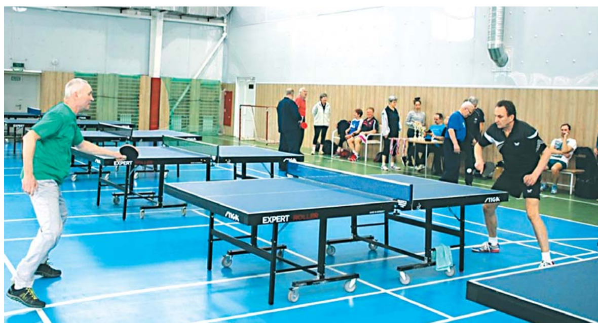
■ Настольный теннис доступен и в пожилом возрасте.

■ Ольга САНИНА, фото автора и из архива ГБУ «Фаворит»