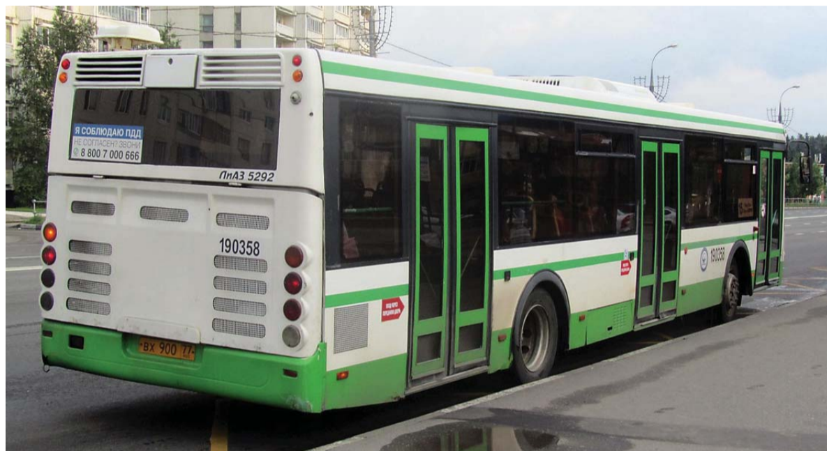
■ В зеленоградский автокомбинат поступило 73 новых автобуса.

В редакцию газеты обратилась женщина, обеспокоенная состоянием общественного транспорта в Зеленограде: – Автобусы ходят переполненные, грязные, душные. За непродолжительное время жары уже несколько человек потеряли сознание в автобусах, кондиционеры зачастую не работают, – жалуется женщина. При этом, по словам зеленоградки, водители резко отправляются от остановок, спешат, резко останавливаются, не соблюдают расписание.