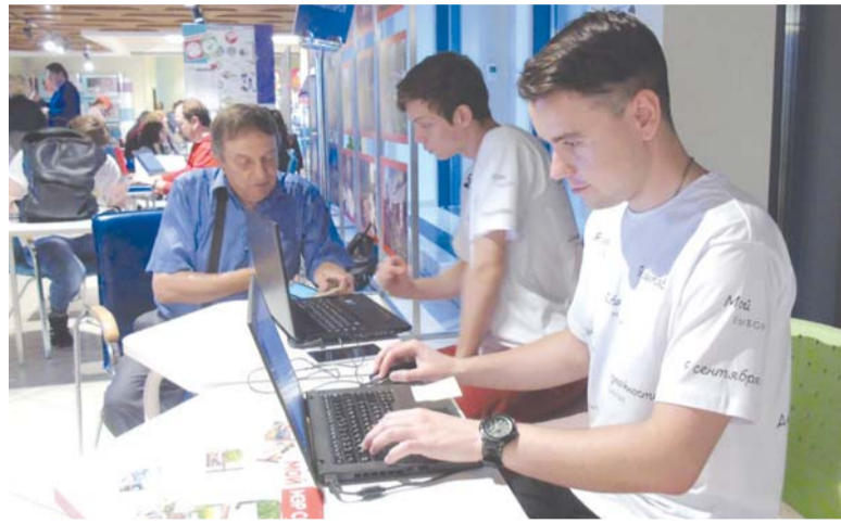
■ В штабе кипит работа.

Одной из главных тем является сбор наказов горожан, на которых будет основываться предвыборная программа Собянина. Любой желающий может на сайте, в общественной приемной или непосредственно через штаб оставить пожелания кандидату для развития Москвы.