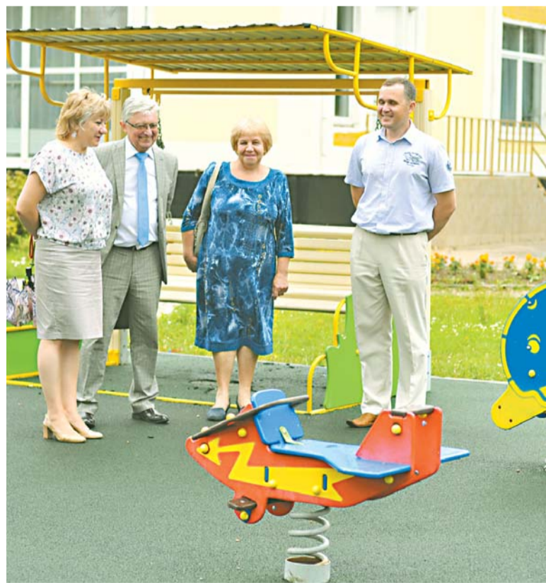
■ Во дворе ГБУ ЦПСид.