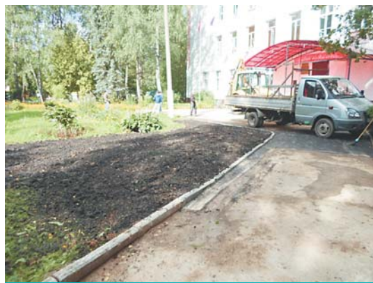
Благоустройство после замены сетей ТС школы в Андреевке

В сентябре начаты работы по замене изношенных сетей водопро-