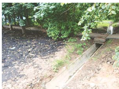
Восстановленный водосток и благоустройство после замены сетей у домов 5-7