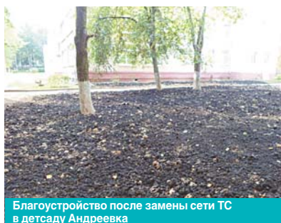
Благоустройство после замены сети ТС в детсаду Андреевка

вода в селе Алабушево, в наиболее аварийных местах по результатам эксплуатации. Уже заменен водопроводный ввод от колодца в д. 5 по улице Линейной с. Алабушево.