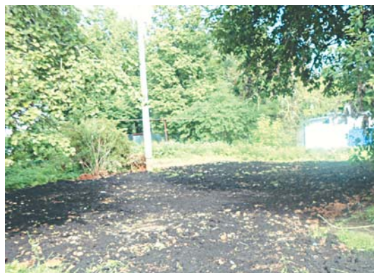
Благоустройство после замены канализации за д. 12 в в/ч 45680 Алабушево