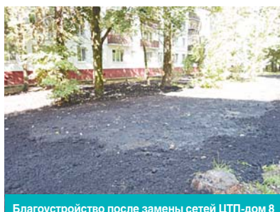
Благоустройство после замены сетей ЦТП-дом 8