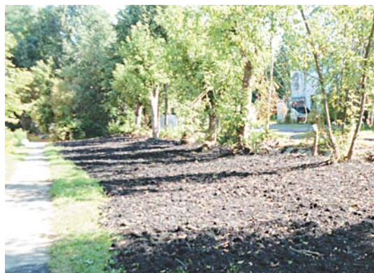
Тепловые сети в в/ч 45680 к дому 5