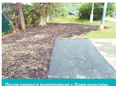
После ремонта водопровода у Дома культуры