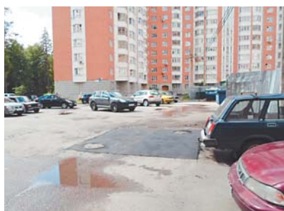
Асфальтирование после ремонта тепловых камер в Голубом, ул. Родниковая