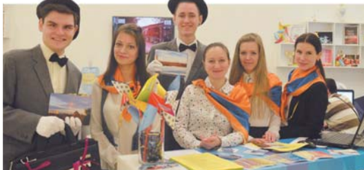
Стенд КЦ «Зеленоград» пользовался огромной популярностью

За три дня работы стенда ЗелАО его посетили несколько тысяч человек. Гости форума могли не только принять участие в различных мастер-классах, но и узнать об инновациях и современных подходах в учреждениях культуры, о предстоящих мероприятиях, записаться в кружки и студии, получить подробную информацию о работе зеленоградских культурных центров.