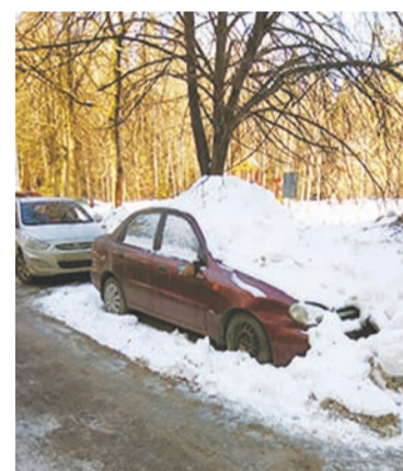
Корп. 501: этой машины здесь больше нет

В ответ мы рады сообщить, что комиссия по работе с брошенными и разукomплекто-