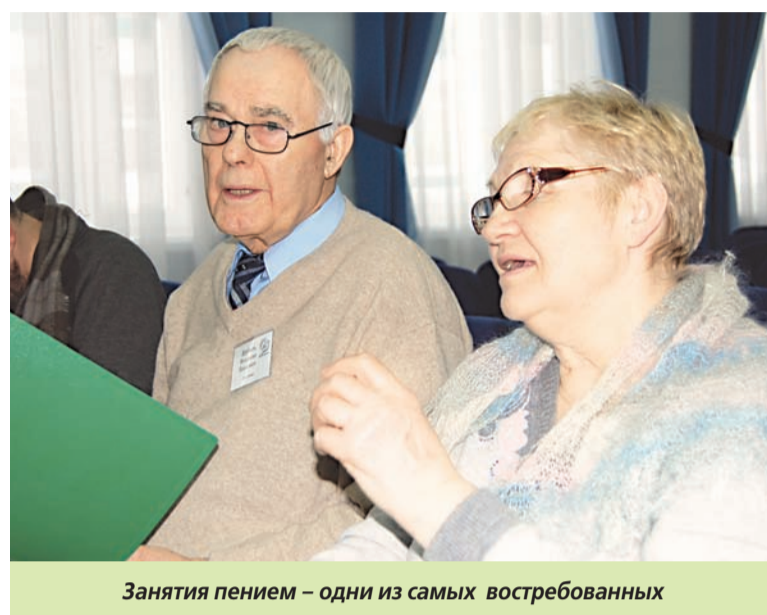
Занятия пением – одни из самых востребованных

В зале реабилитационного отделения поликлиники №201 проходят занятия лечебно-оздоровительной гимнастикой.