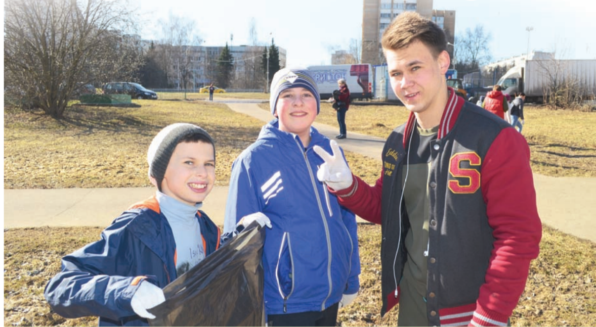
ГБУ «Славяне» проводит экоурок во время субботника

проблемными. При этом мусора собрано значительно меньше, чем в прошлом году.