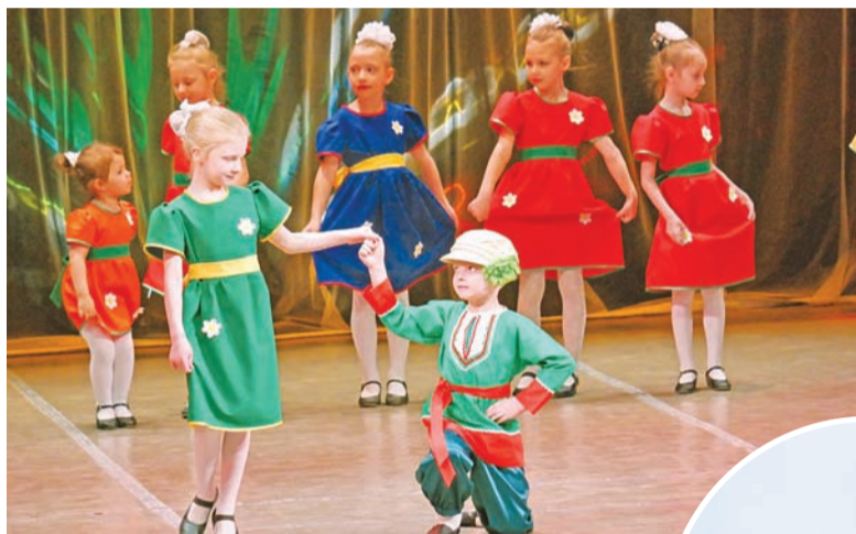
Выступает танцевальный ансамбль «Вдохновение»