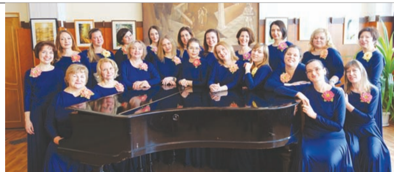
Хор «Ирида» примет участие в фестивале «Московская весна А Carrella»

А во время майских праздников этого года в Москве