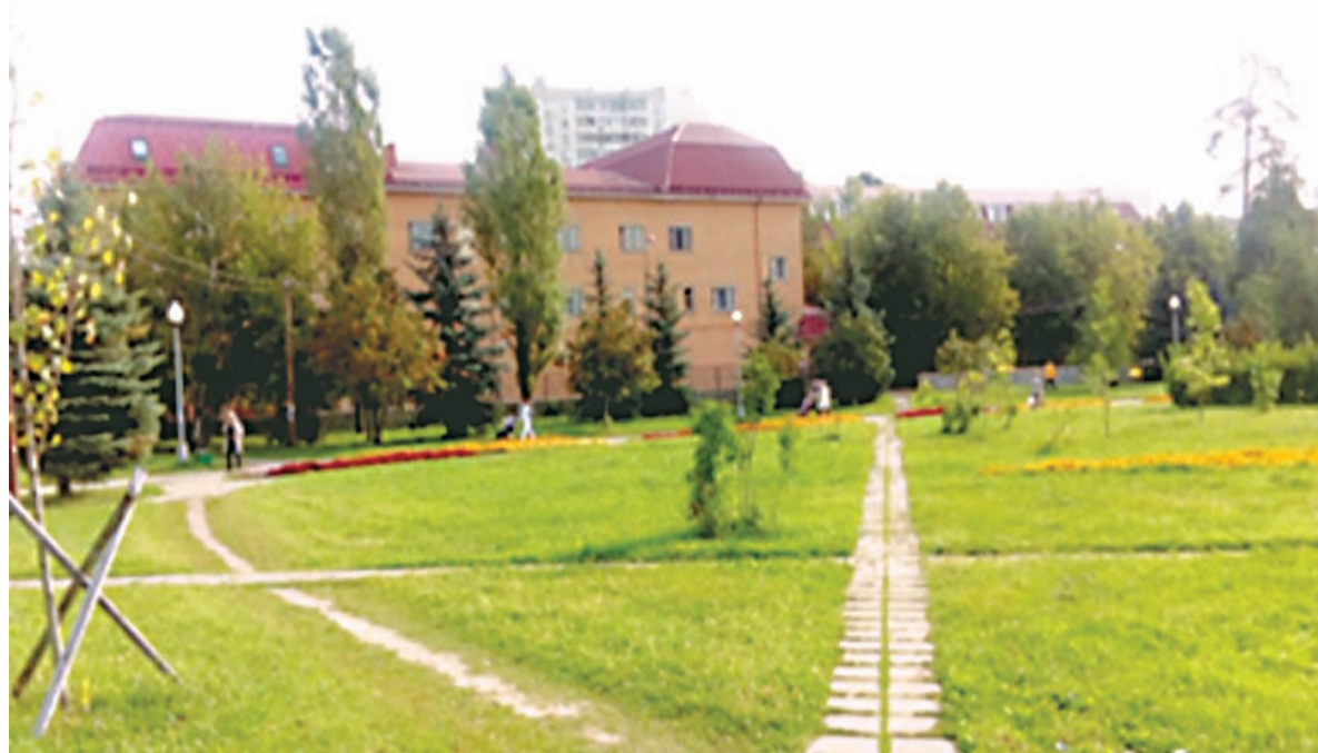
16-й мкрн сегодня