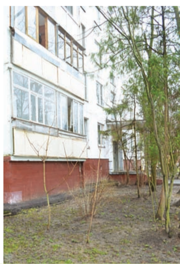
Корп. 433: было и стало