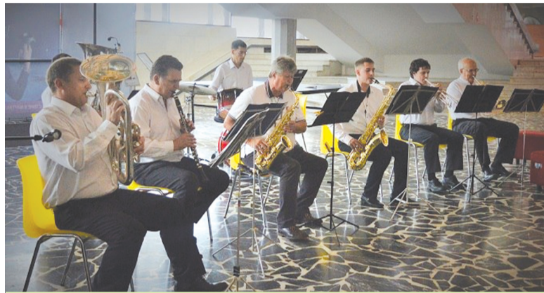
Любительский духовой оркестр – новое достижение КЦ

жения интересов, рассчитанным на все возрастные группы, дающим возможность выразить себя во всех видах творчества.