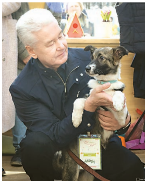
В доме С.Собянина появился новый жилец – собака Джоуи

Об этом событии мэр затем сообщил на своих страницах в социальных сетях «ВКонтакте» и «Twitter».