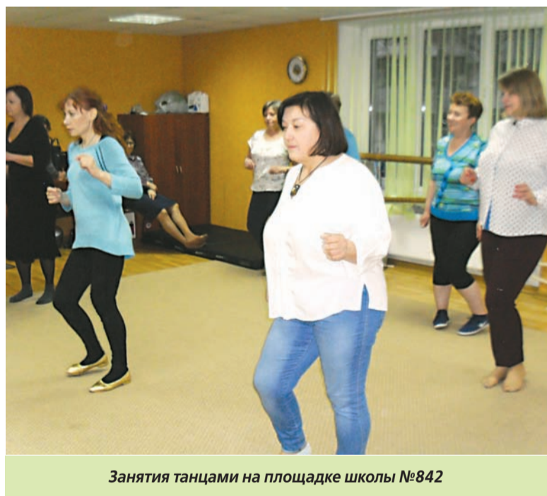
Занятия танцами на площадке школы №842

В Зеленограде участниками проекта «Московское долголетие» особенно востребованы танцы, общефизическая подготовка (ОФП), хоровое пение и, конечно же, кулинарное искусство.