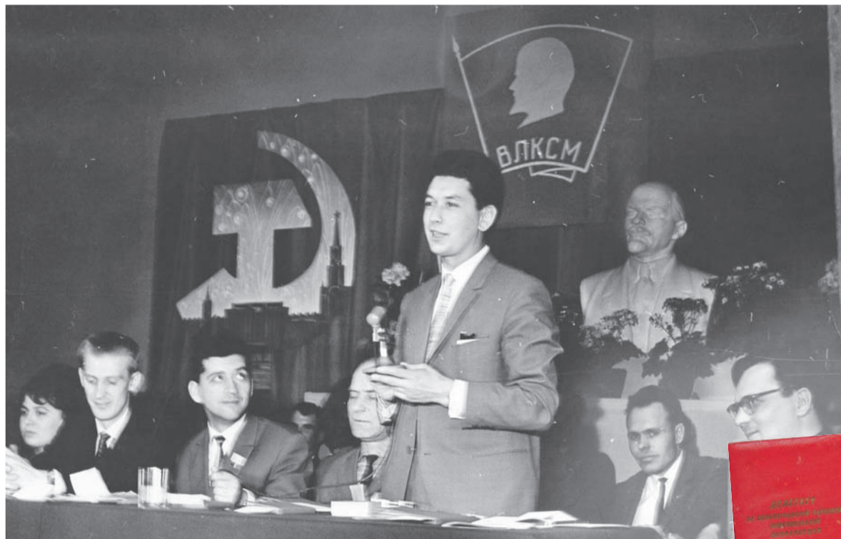
Президиум 1-й зеленоградской районной комсомольской конференции 20.04.1965 г.

Важной задачей в решении вопросов освоения космоса являлось наращивание темпов развития микроэлектроники – главного поставщика элементной базы для космических аппаратов и военной техники. Значимость этой работы подчеркнул в своем выступлении