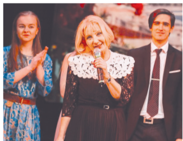
Театр «Контакт» – это не только постановка, но и постоянный тренинг

Культурному центру «Зеленоград» 17 апреля исполнилось 35 лет! Он стал вторым по величине универсальным театрално-концертным и культурно-досуговым комплексом в Москве.