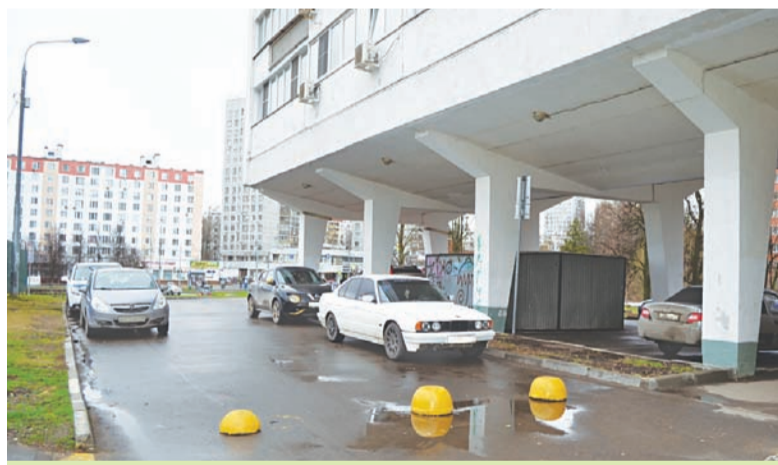
Корп. 360 «Флейта»: ограничители установлены

сезон зимней уборки, они восстанавливаются в плановом порядке. В частности, у корп. 360 они уже установлены.