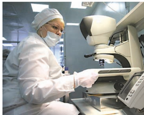
Инновационные предприятия присутствуют в каждом округе Москвы

Мы уже сообщали о том, что московские власти и корпорация «Роскосмос» заключили соглашение о сотрудничестве, в рамках которого в столице будут создаваться промышленные и инновационные кластеры.