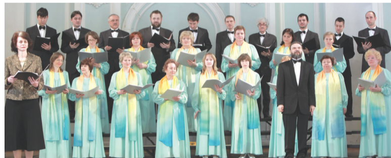
Хор «Ковчег» – ровесник КЦ «Зеленоград»

Балетная студия «Грация» уникальна тем, что ее руководи-