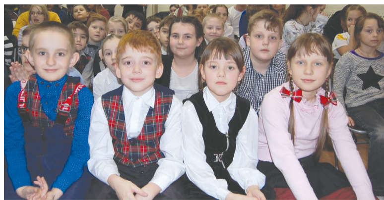
Самые внимательные слушатели – дети