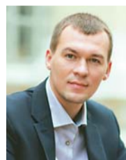
Председатель комитета Госдумы по физической культуре, спорту, туризму и делам молодежи Михаил ДЕГТЯРЕВ (ЛДПР)

Лозунг предвыборной программы – «Москва – это люди». По заявлениям кандидата, политика будущей столичной администрации должна быть направлена на заботу о жителях города. На первом месте стоят социальные вопросы, а не мероприятия. В частности, стоимость тарифов ЖКХ, по мнению кандидата, не соответствует качеству предоставляемых услуг. Если подойти к этому вопросу более рационально, считает кандидат, тарифы на коммунальные ресурсы можно сделать менее обременительными для граждан.