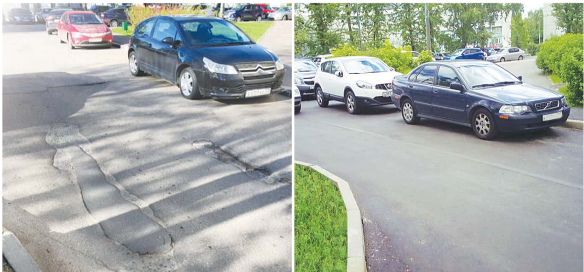
■ Дорогу теперь покрывает ровный асфальт, а не «заплатки».

В районе Старое Крюково в этом году предусмотрены и другие благоустроительные работы.