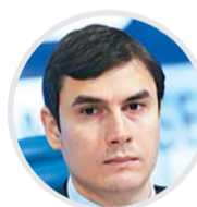
Как сказал член рабочей группы, депутат Госдумы от КПРФ Сергей Шаргунов, организация загородных участков даст избирателям больше возможностей для реализации своих прав:

В обсуждении принимали участие представители всех политических партий, в том числе движения в защиту прав избирателей «Голос».