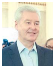
Мэр Москвы Сергей СОБЯНИН (самовыдвиженец)

В МГИК зарегистрированы четыре кандидата на пост мэра Москвы, выборы которого пройдут 9 сентября.