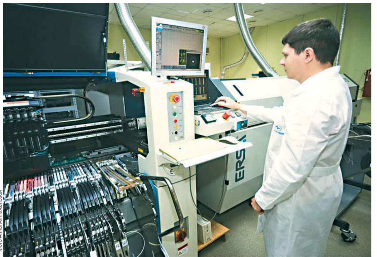
■ За полтора года на предприятиях Зеленограда создано около 1000 новых рабочих мест.

Наверное, положение дел в промышленности и на рынке труда в Зеленограде еще нельзя считать идеальным, но прогресс последних лет очевиден. Для нас важно, что многие жители округа услышали ответы на вопросы, которые их беспокоят.