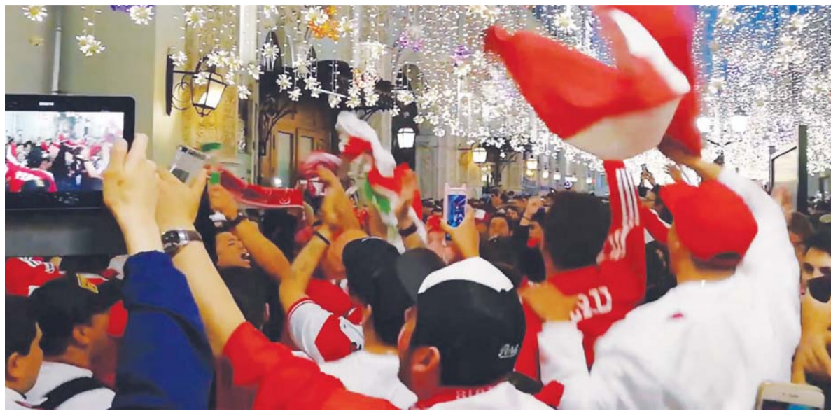
■ В столице центром футбольного праздника стала Никольская улица.