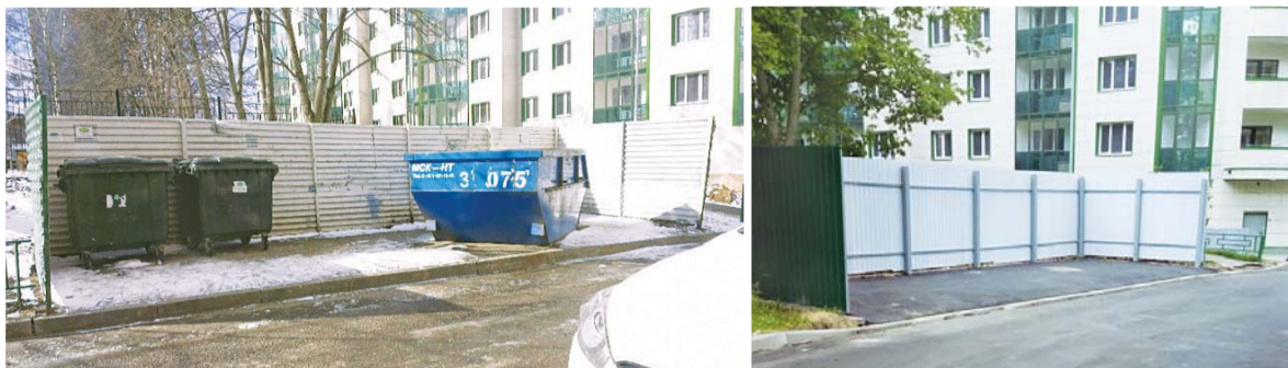
■ Контейнерная площадка у корпуса 830 отремонтирована.