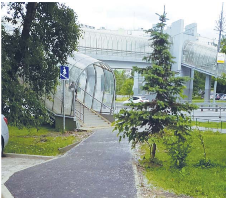
■ Для удобства жителей проложена дополнительная дорожка к переходу.