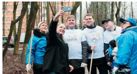
22 апреля у нас пройдет второй общерайонный субботник «Чистое Подмосковье. Сделаем вместе.»