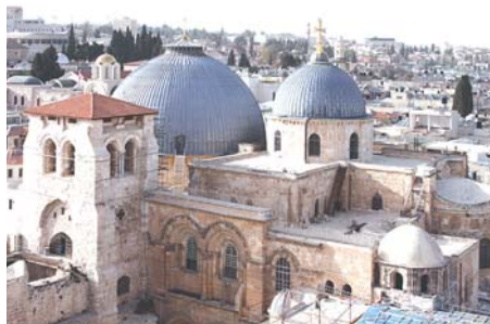
Храм Гроба Господня

Паломничество. Пыльные дороги, истоптанные сапоги (а в большинстве - лапти), ночлег где придется, еда какая случится. Это было в прошлых веках. В XX, а уж тем более в XXI, все изменилось. Самолеты, автобусы, туристические агентства, гиды, гостиницы - все просто и доступно.