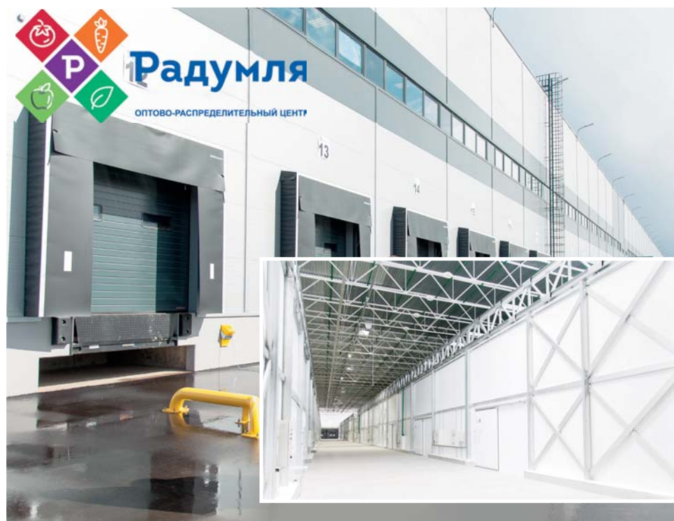
Читайте на стр. 2

Солнечногорским фермерам предложили бесплатные торговые места у одного из крупнейших инновационных операторов Подмосквья