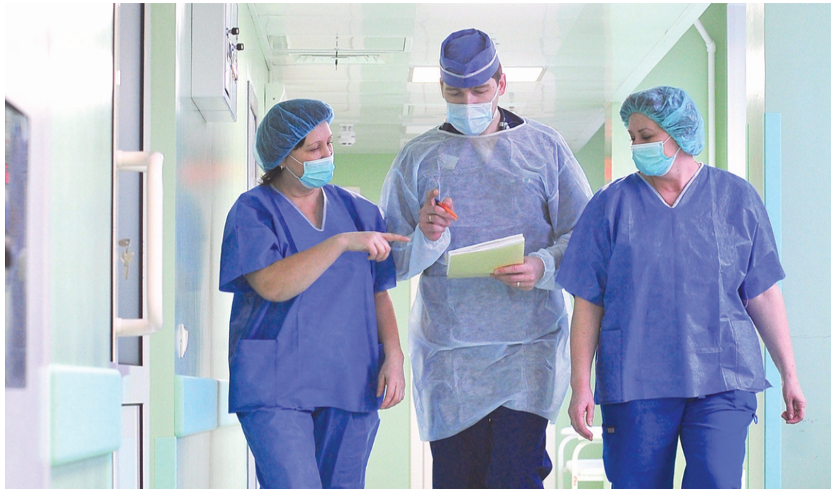
Резерв медицинских управленческих кадров сформируют с помощью конкурса

Столичное здравоохранение за последние годы значительно укрепилось благодаря систематической, целенаправленной работе по реконструкции, модернизации и техническому оснащению лечебных