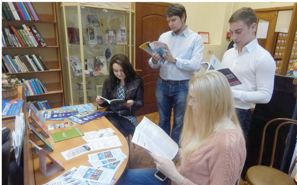
Библиотеки функционируют, но в данный период они должны функционировать иначе, по-новому