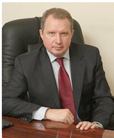
А.Хрипун, Министр Правительства Москвы, руководитель Департамента здравоохранения Москвы

Департамент здравоохранения столицы проведет открытый конкурс для формирования резерва управленческих кадров. Решение об этом принято на заседании президиума правительства Москвы.