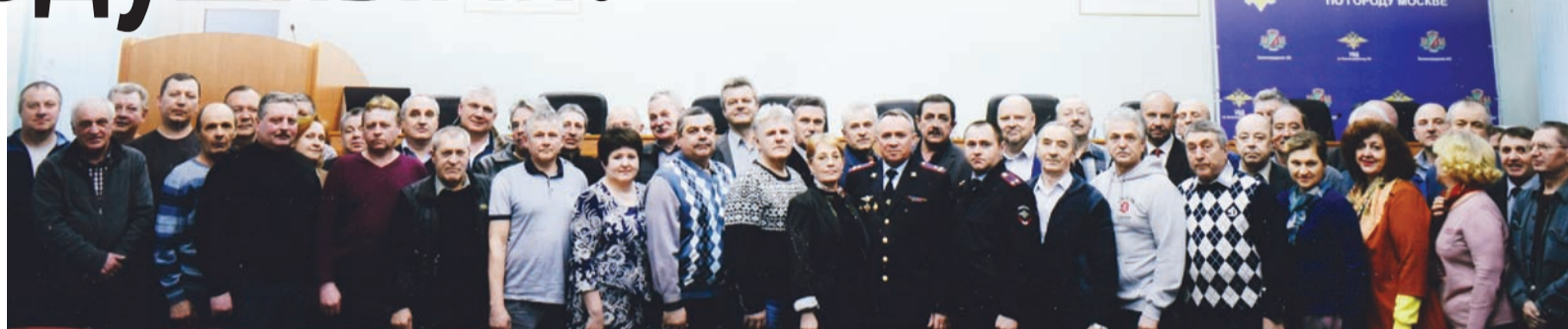
Одна из самых важных задач ветеранской организации Управления внутренних дел – военно-патриотическое воспитание молодежи