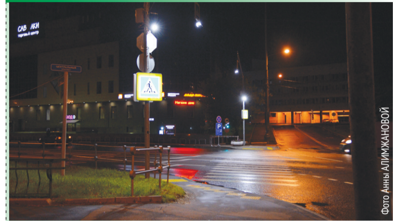
Нерегулируемые пешеходные переходы на Савелкинском проезде и проспекте Генерала Алексеева у остановки «Кинотеатр «Электрон» оснастили дополнительной подсветкой.

13.15, Химки – в 13.23, прибытие на Ленинградский вокзал – в 13.37. Сегодня экспресс отправляется напрямую из Зеленограда в 12.54.