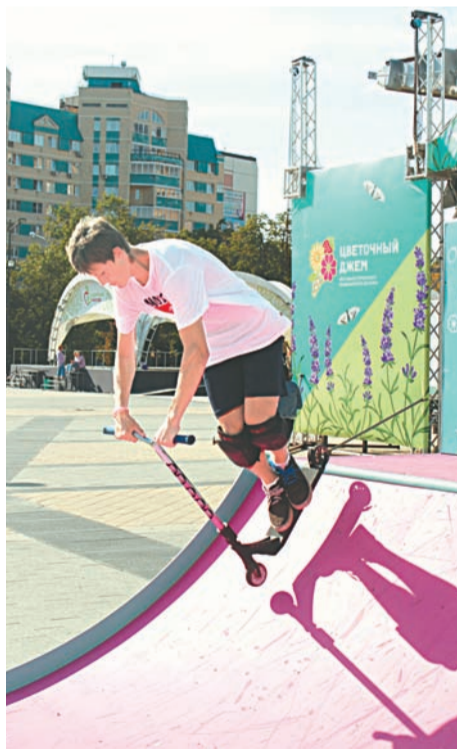
На площади Юности молодежь развлекается на скейтдроме

Лучшие цветники выберут сами участники, проголосовав за понравившиеся проекты (кроме своего), каждый на