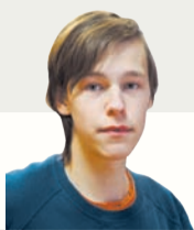
БЛОГЕР САША КУЗЬМИН