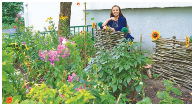
Корп. 921, 3-е место в номинации «Вальс цветов». Автор – Вера Санаева