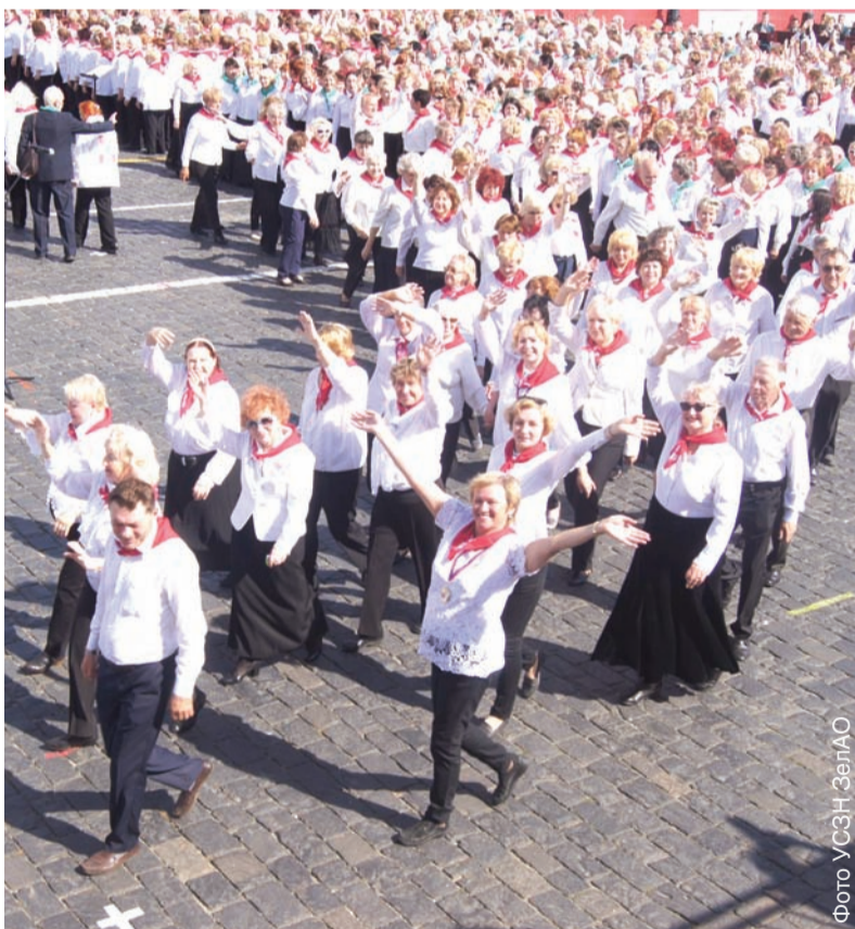
На фестивале выступил сводный хор «Московского долголетия» из Зеленограда

В первую очередь программа рассчитана на женщин от 50 лет, однако попробовать себя в новой профессии и записаться на занятия может любой желающий. В день стажировки бебиситтеры могут прийти в игровую комнату центра «Моя карьера» сами или со своими детьми и внуками в возрасте от года до шести лет. В присутствии куратора проекта они должны продемонстрировать все знания и навыки, полученные ранее.