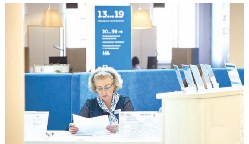
Записаться на занятия может любой желающий

Первые уроки уже прошли в центре занятости «Моя карьера» по адресу: улица Сергия Радонежского, дом 1, строение 1. Провели их психологи городского сервиса «Бабушка на час». После теоретического курса у учеников девятичасовая стажировка в игровой комнате центра «Моя карьера». По итогам полного прохождения программы выпускникам школы выдаются специальные сертификаты. Для поступления в «Школу бебиситтеров» необходимо заполнить заявку. Следующий курс