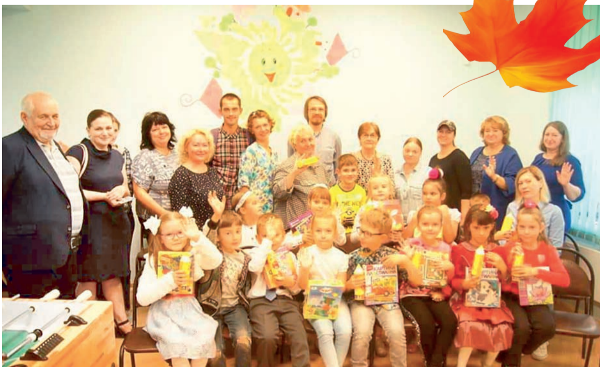
Первоклашки Старого Крюково получили подарки

■ В преддверии учебного года в филиале «Солнечный» ТЦСО «Зеленоградский» по инициативе депутатов муниципального округа Старое Крюково состоялся праздник «Скоро в школу».