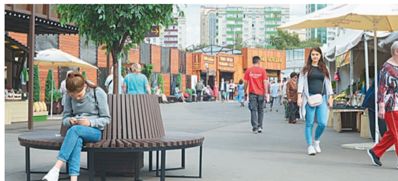
Крюковский рынок преобразился

Гостей ждут показательные выступления барабанщиков, воздушных эквилибристов, мастеров единоборств, песни и танцы