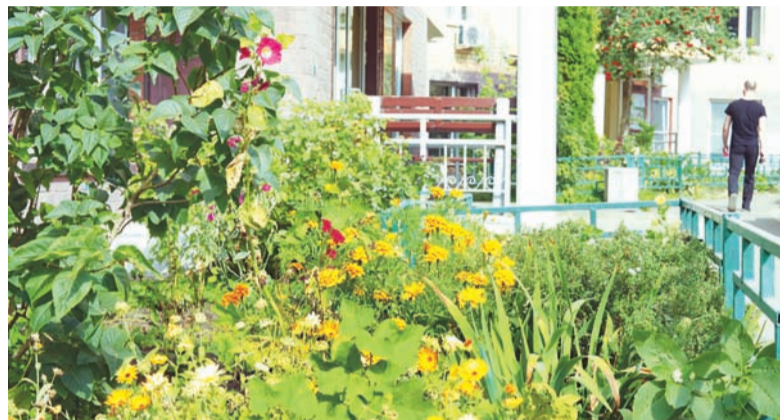
Корп. 830, 2-е место в номинации «Вальс цветов». Автор – Нина Баранова