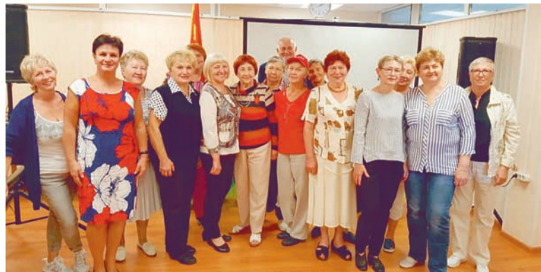
Награждение участников конкурса