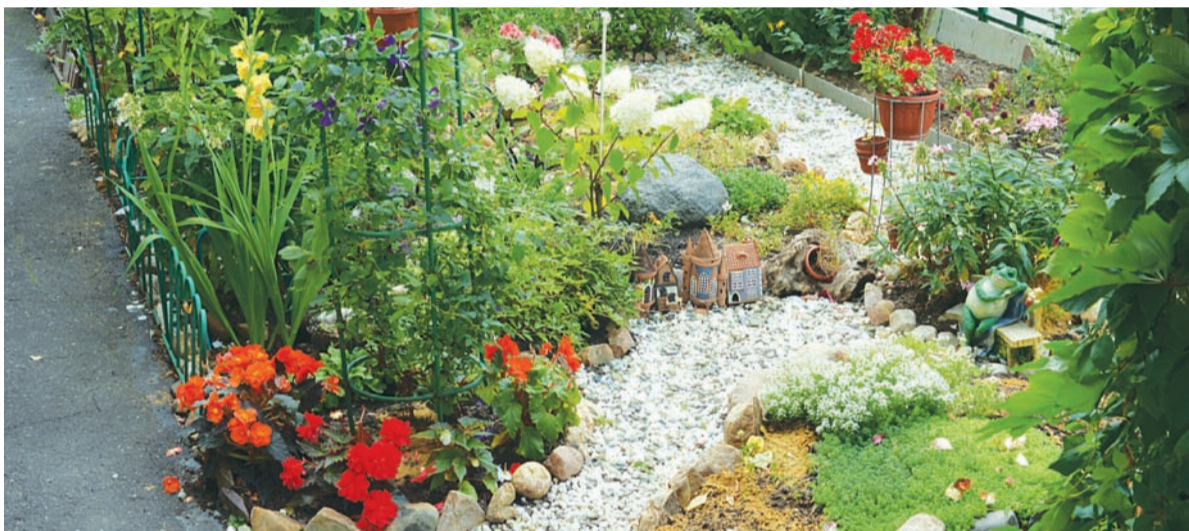
Корп. 906, 1-е место в номинации «Вальс цветов». Автор – Галина Кутакова

Каждый год инициативные граждане радуют нас своими клумбами, создавая красоту трудом, усердием, заботливо продлевая лето.