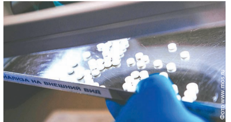
Лекарства будут выпускать в Москве