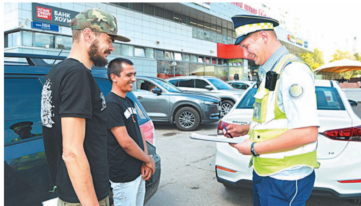
При оформлении ДТП помогут сотрудники ГИБДД и специалисты ЦОДД