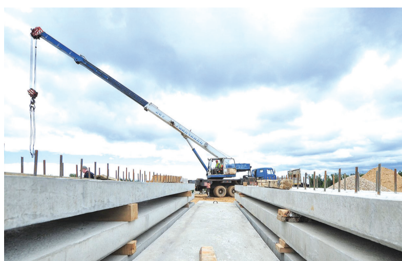
Юго-Восточная хорда соединит 10 районов Москвы

По итогам работы инспекции в Московском парламентском центре состоялся круглый стол «Безопасное строительство Юго-Восточной хорды», была составлена резолюция, обращенная к мэру Москвы Сергею Собянину, с просьбой приостановить строительство для проведения дополнительного комплексного обследования территории.