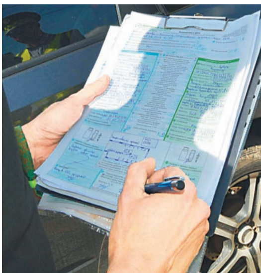
Составить европротокол удобно

Изменения в ст.11 и 12 ФЗ №448, вступившие в силу с 1 июня 2019 года, увеличили лимит выплаты по ОСАГО до 100 тысяч рублей по всем регионам РФ. Причем в Москве, Московской области, Санкт-Петербурге и Ленинградской области максимальная сумма денежной компенсации стоимости ремонта может составить 400 тысяч