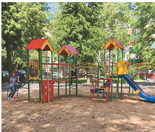
« Детские площадки