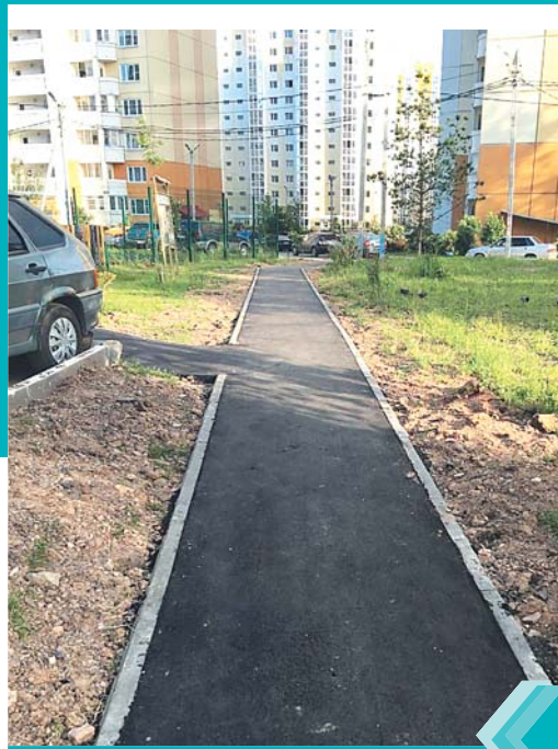
Асфальтовая дорожка от д. 3 к д. 5/2.