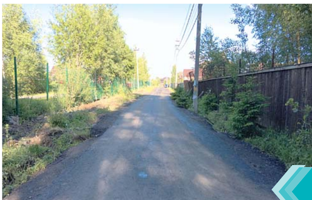
Выполнены работы по устройству асфальтового покрытия на ул. Дачной в рп Андреевка