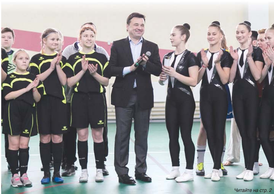
Читайте на стр. 2

Губернатор Андрей Воробьев и министр спорта Московской области Роман Терюшков приняли участие в открытии ФОКа в Поварово