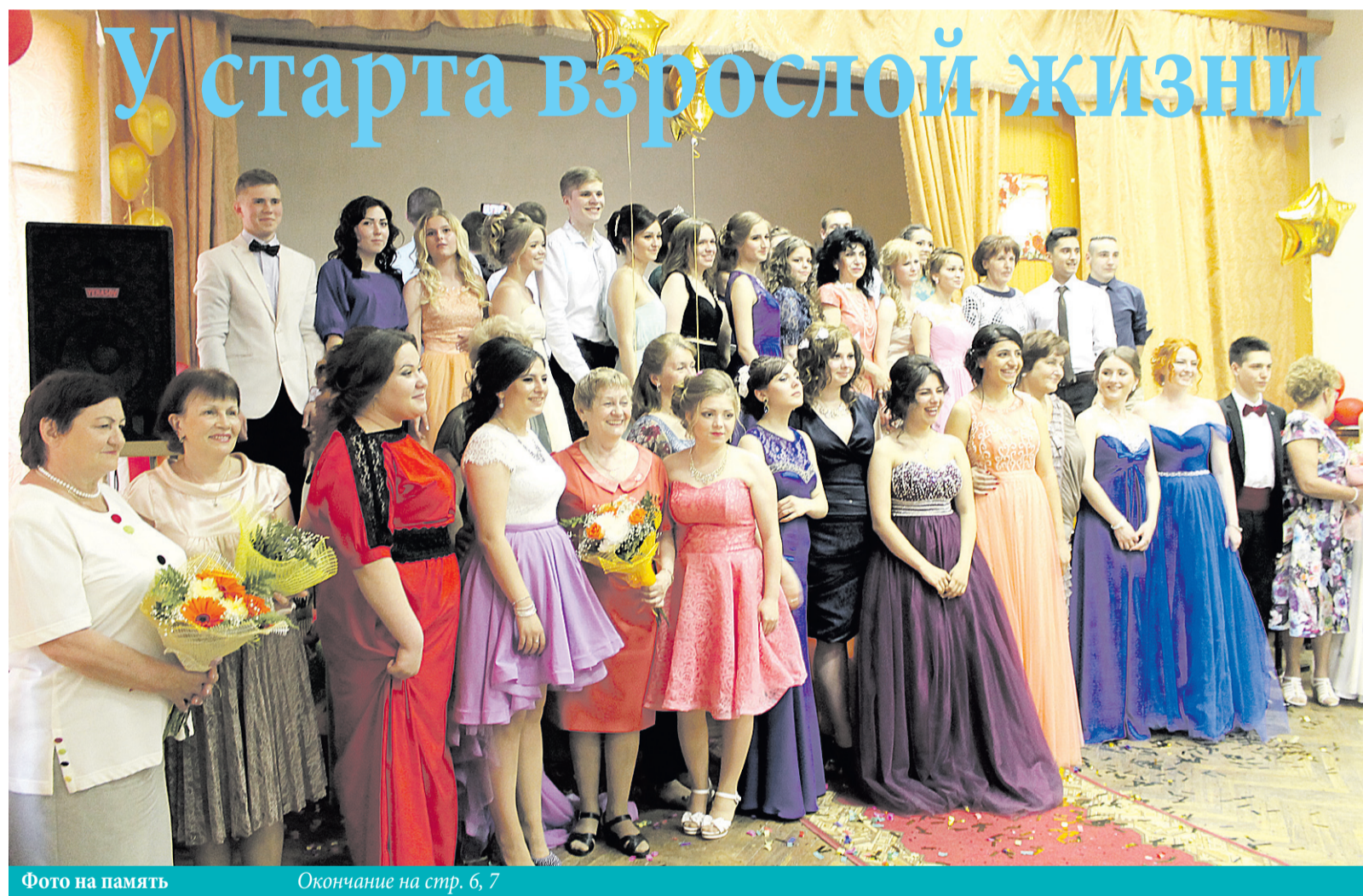
Фото на память Окончание на стр. 6, 7

приоритетного Национального проекта «Образование» среди школ РФ; члена Ассоциации «Лидеры образования Подмосковья».