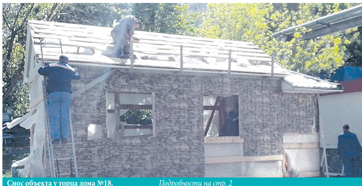
Снос объекта у торца дома №18. Подробности на стр. 2

Последние годы пространство Москвы и столичного региона преобразуется: исчезают уродливые палатки, гаражи-ракушки, неопрятные и разномастные рекламные баннеры и конструкции. И, кажется, что становится легче не только смотреть на мир, но и дышать. 10 мая в городском поселении Андреевка стартовали работы по демонтажу самовольно установленных