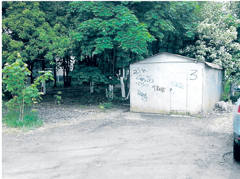
18 мая 2016: до (слева) и после (справа) демонтажа

– На месте, где стоял павильон, будет выполнено благоустройство. Прошел конкурс, определен поставщик услуг. Планируется выровнять тротуар вдоль ул. Жилинской и