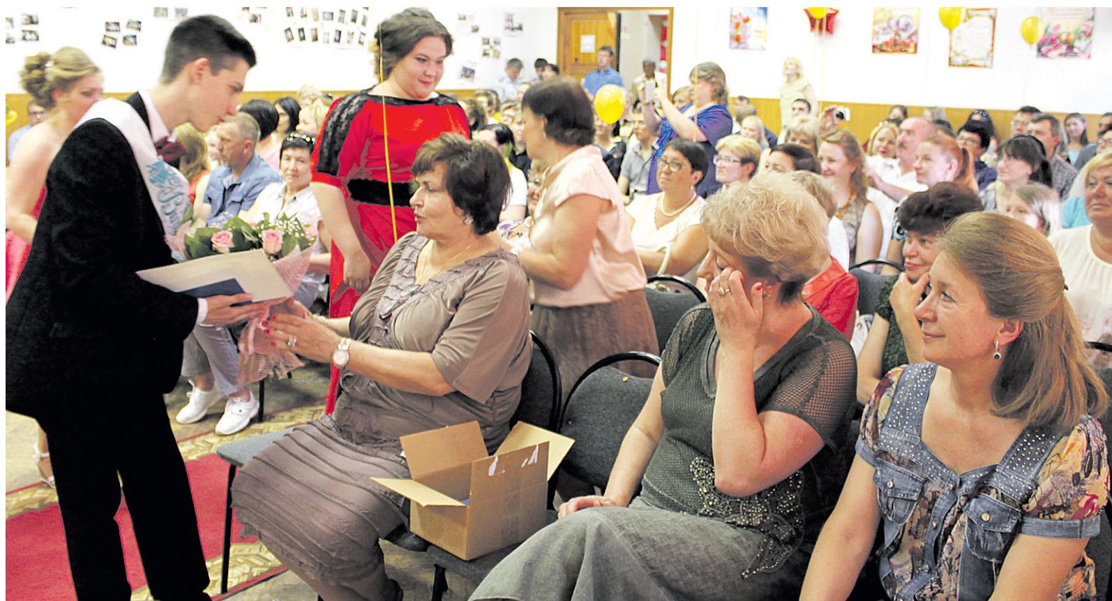
Спасибо вам, учителя!

– Ребятам очень повезло, потому что на протяжении семи лет с ними были замечательные классные руководители. Поэтому сложились замечательно дружные хорошие классные коллективы, – считает директор школы, за-