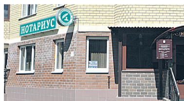
График работы: вторник, четверг, пятница – 10.00-17.00 суббота – 10.00-14.00.