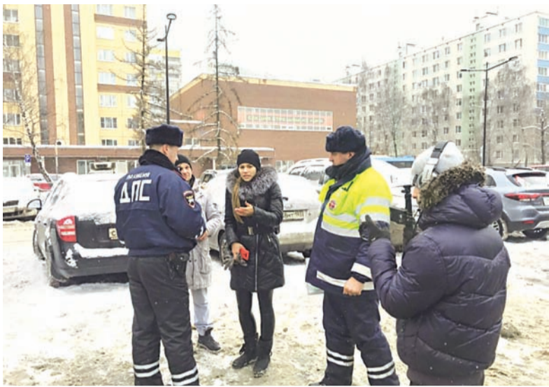
Сотрудники ДПС за работой.