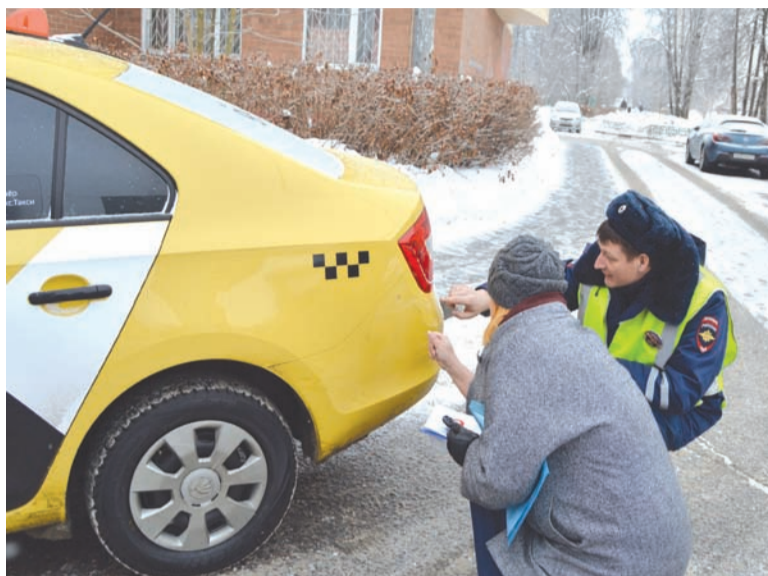
Во дворе корпуса 3 мкрн водитель такси припарковала поздно вечером машину вблизи своего дома.

Подтверждением слов инспектора ГИБДД стало и это ДТП: