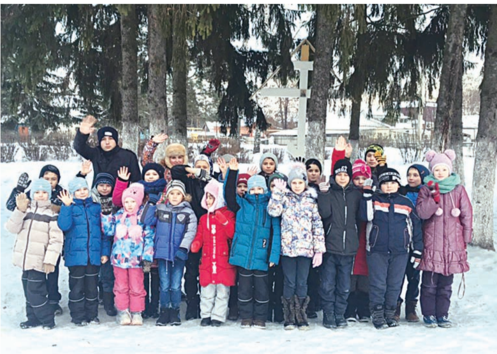
На снимке: воспитанники пансионата.