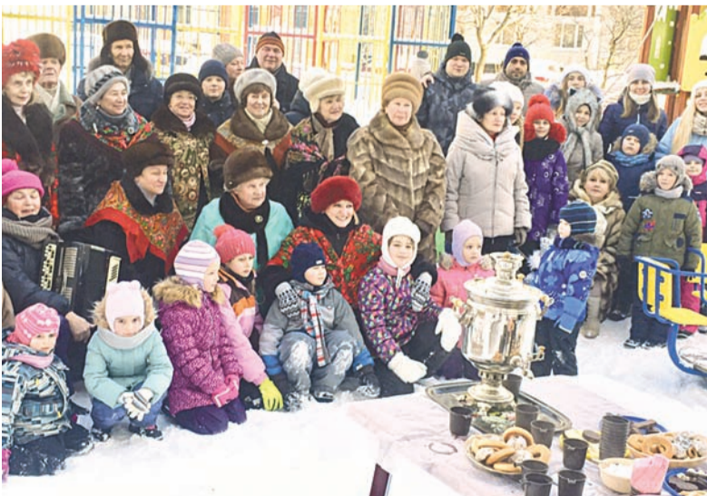
К празднику присоединились жители окрестных домов.

К празднику присоединились жители окрестных домов – их порадовали песни под баян от музыкальных ансамблей «Серебряные голоса» и «Серебряный бас», представление от ансамбля музыкальной инсценировки «Нотный зонтик», а также пляски и игры с веселыми аниматорами. Старый Новый год отметили в прекрасной дружной атмосфере настоящего соседского единства.