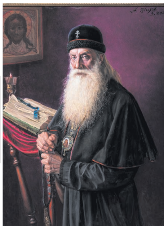
Портрет предстоятеля Русской православной старообряд- ческой церкви митрополита Корнилия. 2018 г. Холст, масло.