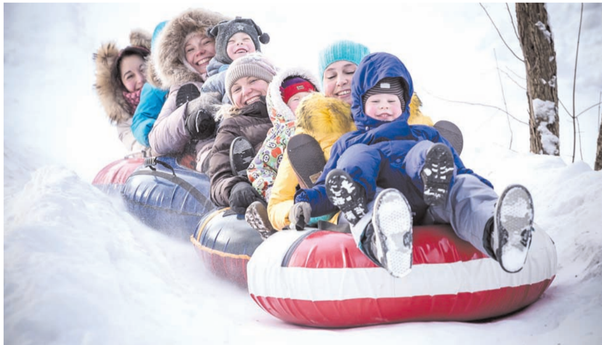
Три ватрушки, вместившие человек семь, – все хохочут, щеки горят!

– Мы очень весело провели каникулы: гуляли, катались на Лисьих горках, на каруселях на