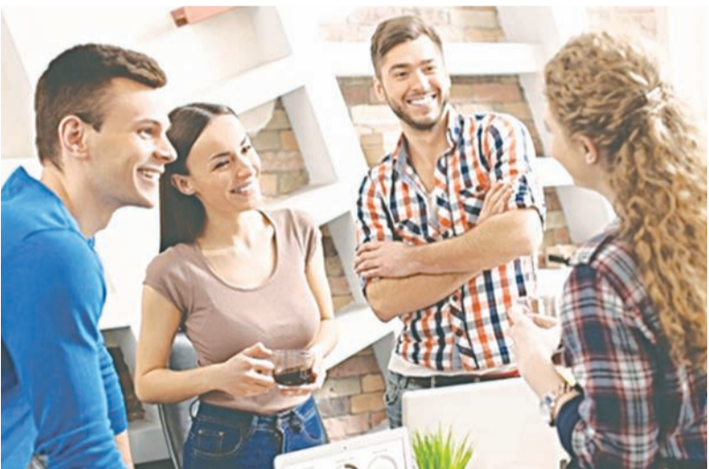
Английский является основным языком международного общения.