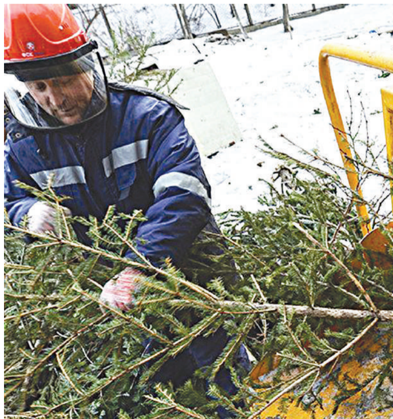
Деревья отправят на перерабатывающие предприятия, где из них сделают древесную щепу и почвогрунт.

■ В Зеленограде работают пункты приема елок для переработки. Сдать хвойные деревья на переработку можно до 1 марта.