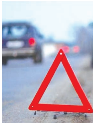
Инспекторы ГИБДД установили, что молодой житель Зеленогра-