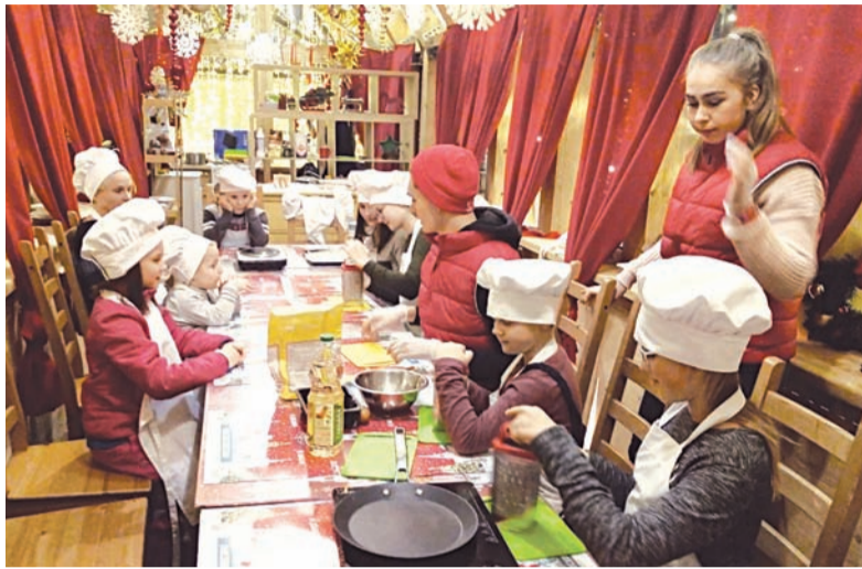
В теплом шале опытные повара учили юных кулинаров готовить традиционные блюда Карелии, Татарстана, Мордовии, Ростова и приморских городов.

Неподалеку в теплом шале опытные повара учили юных кулинаров готовить традиционные блюда Карелии, Татарстана, Мордовии, Ростова и приморских городов. На площадке каждый мог почувствовать себя диджеем и изучить азы этого мастерства. Дети и их родители были рады бесплатно покататься на праздничной двухэтажной карусели, посмотреть кукольные