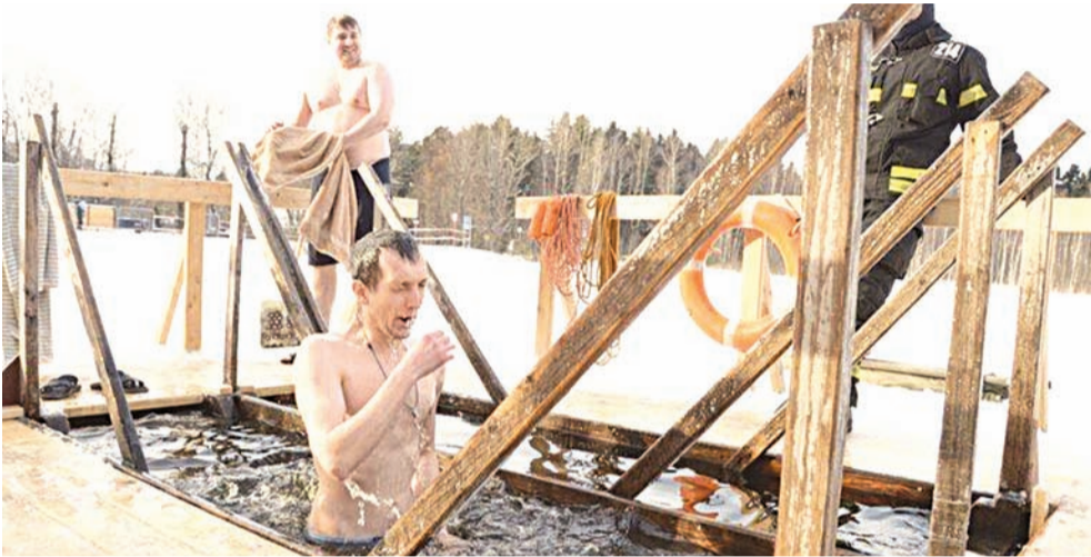
В местах проведения праздничных купаний будет организовано дежурство сотрудников полиции, спасателей и машин скорой помощи.

Для обеспечения развоза участников Крещенских купаний на Черном и Школьном озерах в ночь с 18 на 19 января запланировано продление режима работы маршрута №10 «Станция Крюково – Городская больница» до 03.00.