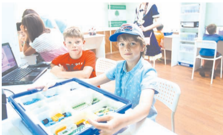
Запущена деятельность кружков по направлениям: робототехника, ракетомоделирование, практическая биология, химическая лаборатория и другое.

Мы активно сражались с мнением, что в библиотеке можно взять только старые книги. В 2018 г. в наших библиотеках заняли место около 2000 новинок последних лет. Мы закупили большие партии современной детской и взрослой литературы у таких издательств как «Белая Ворона», «Самокат», «КомпасГид», «МИФ» и др. Запущена деятель-