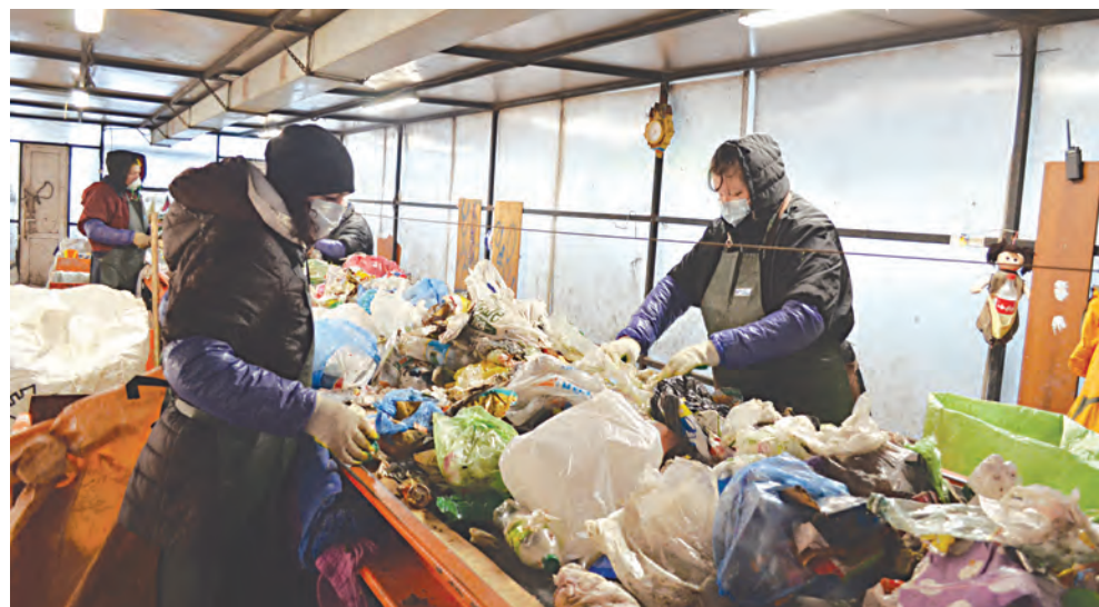
Идет разборка на конвейере

Нужно добиться качественного перелома в сознании жителей. Тогда мечты о том, что 100% наших отходов можно будет перерабатывать с пользой для людей и природы, станут явью.