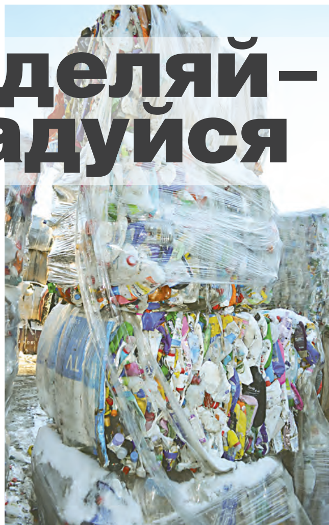
Отсортированное – на переработку

– Именно так. Например, банки из-под мясных консервов – жестяные, из-под напитков – алюминиевые. Их нельзя мешать в одну кучу. Также и пластик – бутылки от воды, минералки, пива – один сорт, от молока, кефира – другой, от моющих средств – третий, пластиковые пакеты –