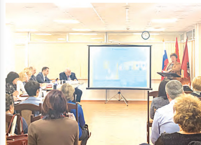
Депутаты заслушали отчеты руководителей района

Полный текст отчетов – на сайте муниципального округа Старое Крюково www.staroe-krukovo.ru .