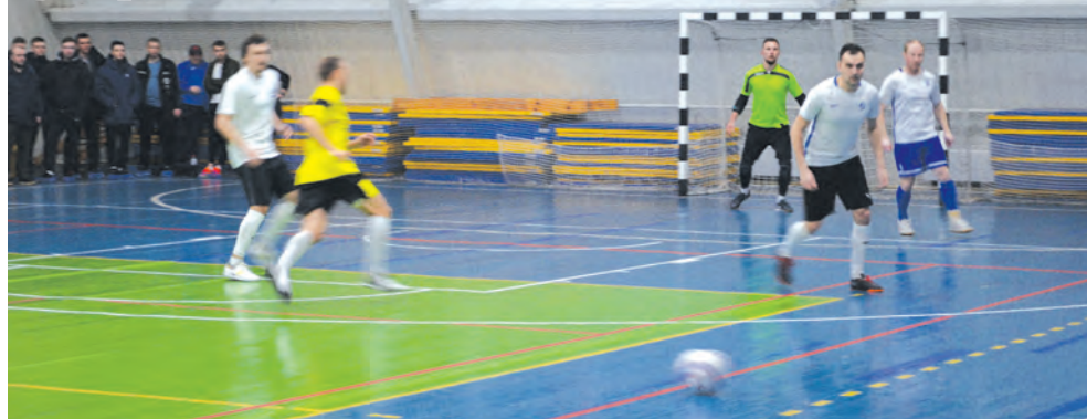
«Динамо» в обороне