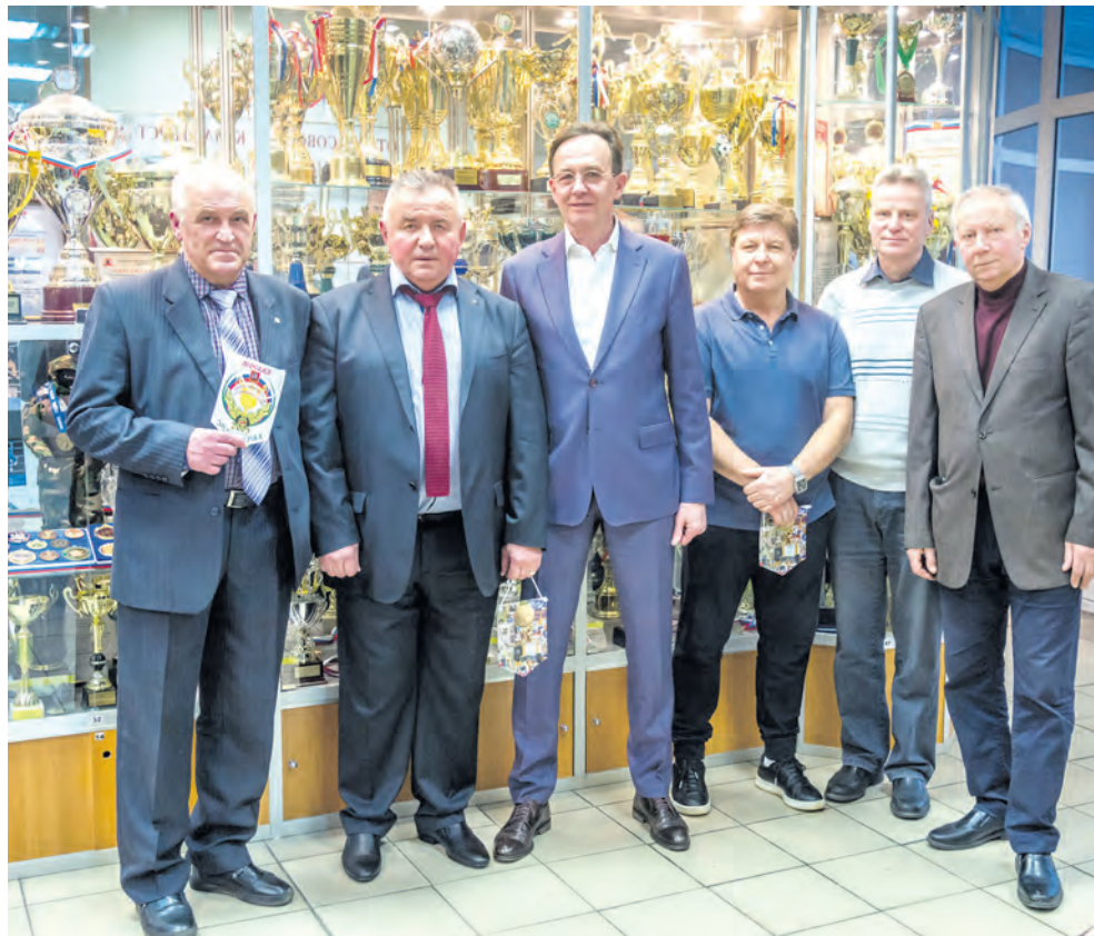
Ветераны футбола приумножили спортивную славу Зеленограда

– Футбол – это действительно зеленоградский спорт. Играл люди разных возрастов, на разном уровне, в разных лигах и турнирах. К примеру, в одной из команд возраст игроков – от 22 до 79 лет. Наши спортивные школы выпускают игроков профессиональных лиг.