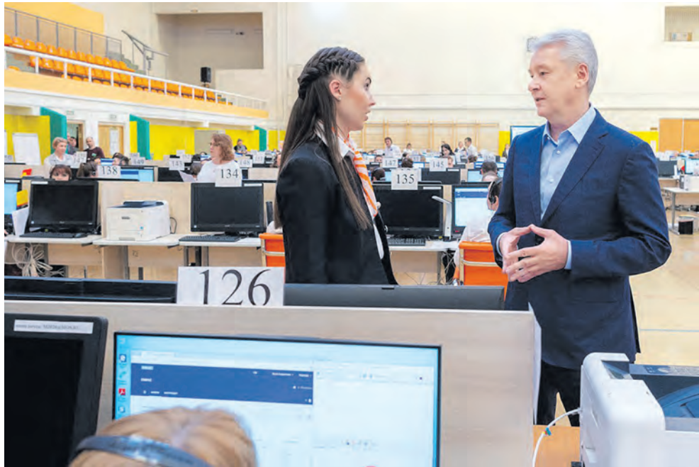
Мэр Москвы Сергей Собянин в колл-центре

■ В Москве работает горячая линия по вопросам коронавируса. Около 200 операторов каждый день отвечают более чем на пять тысяч звонков.