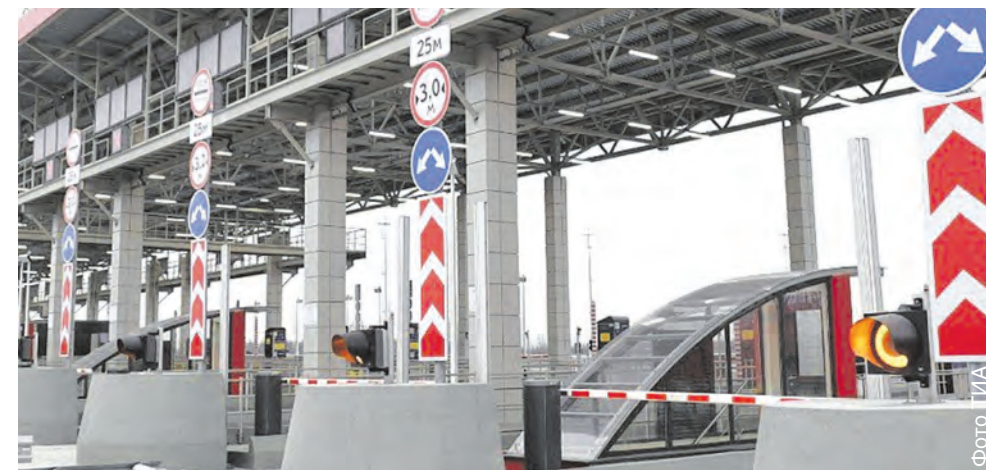
Трасса М11. Пункты оплаты проезда