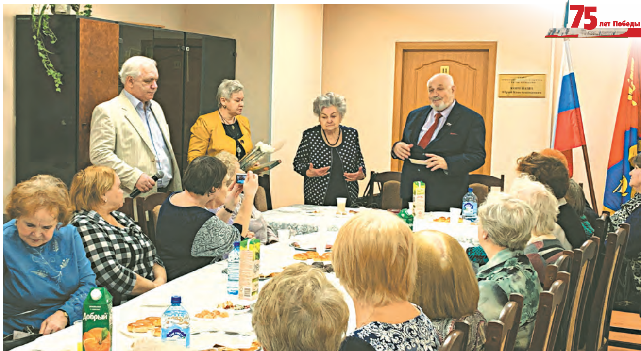
Медаль «К 75-летию Победы» вручается ветерану