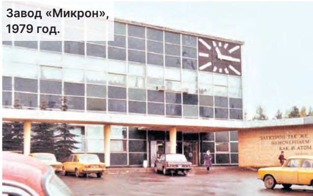
Завод «Микрон», 1979 год.

Прошлое на выставке читается не только в предметах, но и в воспоминаниях жителей Зеленограда. С большой теплотой они вспоминают как времена советского прошлого, так и 90-е годы