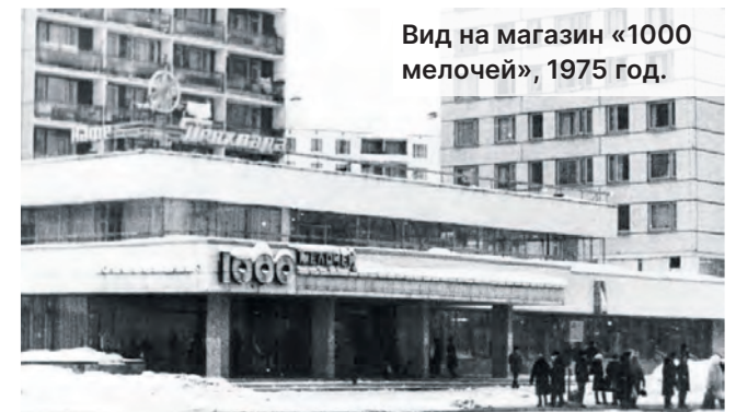
Вид на магазин «1000 мелочей», 1975 год.

XX века, например, первую пиццерию, кафе, расположенное в универмаге.