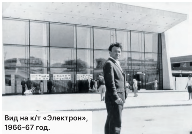
Вид на к/т «Электрон», 1966-67 год.

стрем» и «Элма», жилыми корпусами и домами, кинотеатрами. Строили широкие площади, сооружали красивые фонтаны. Универмаг «1000 мелочей» стал одним из символов Зеленограда. В нем можно было купить все: от утюга и люстры до сервизов и радиоприборов. В выставочном зале представлены образцы продукции, производив-