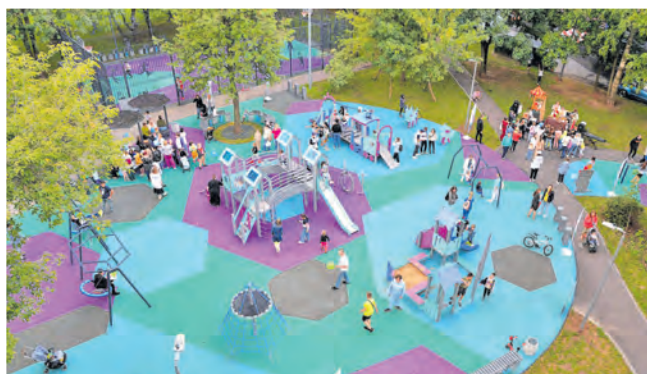
Двор у корпуса 904, благоустроенный при участии зеленоградцев.

■ Двор корпусов 1113 и 1114 в районе Силино включен в программу соучаствующего проектирования.