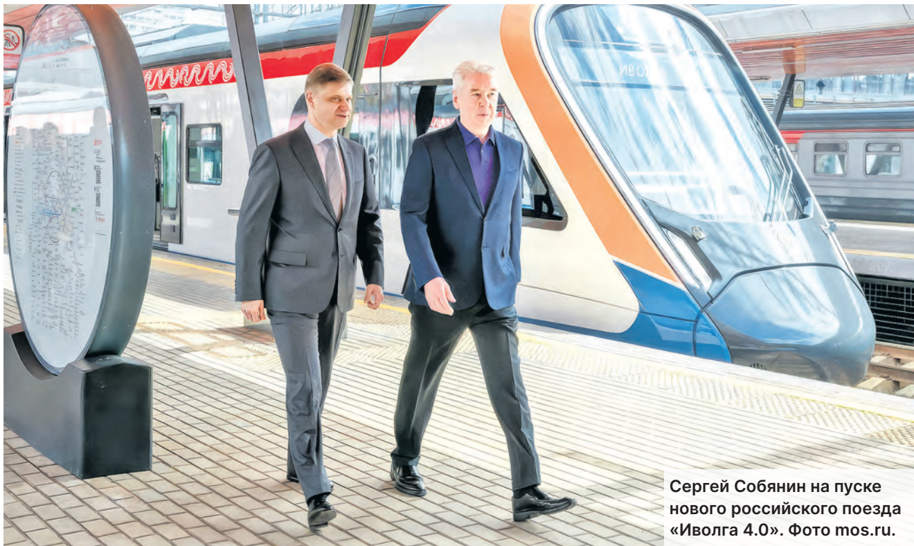
Сергей Собянин на пуске нового российского поезда «Иволга 4.0».

■ На линии Московских центральных диаметров (МЦД) вышли новые поезда «Иволга 4.0». Старт движению дал мэр Сергей Собянин и гендиректор ОАО «РЖД» Олег Белозеров.