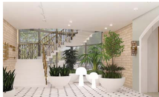
Планировочное решение холла 2-го этажа

Главный принцип будущего архитектурно-планировочного решения – сделать посещение