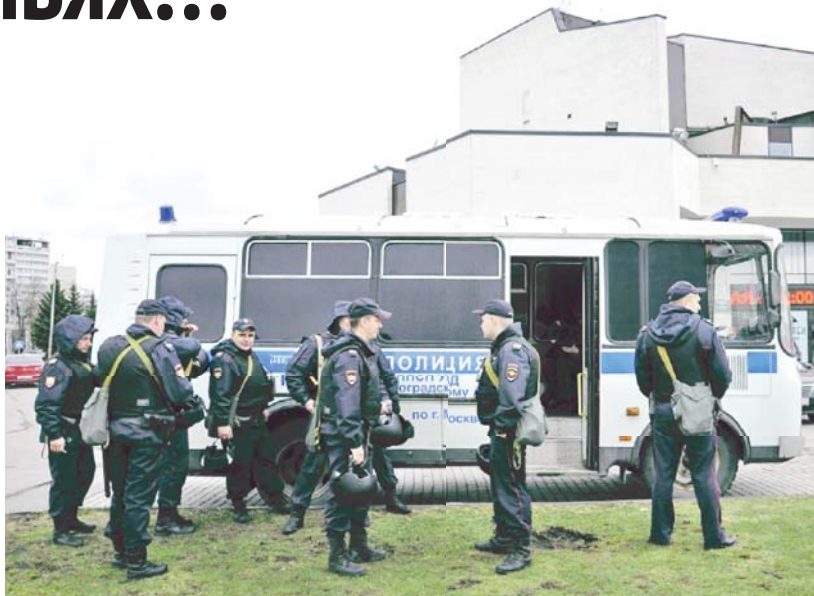
Полиция у здания КЦ «Зеленоград»

Помните, если заложник проводит много времени с террористами, ему может показаться, что они вместе, а весь мир – против них. Это