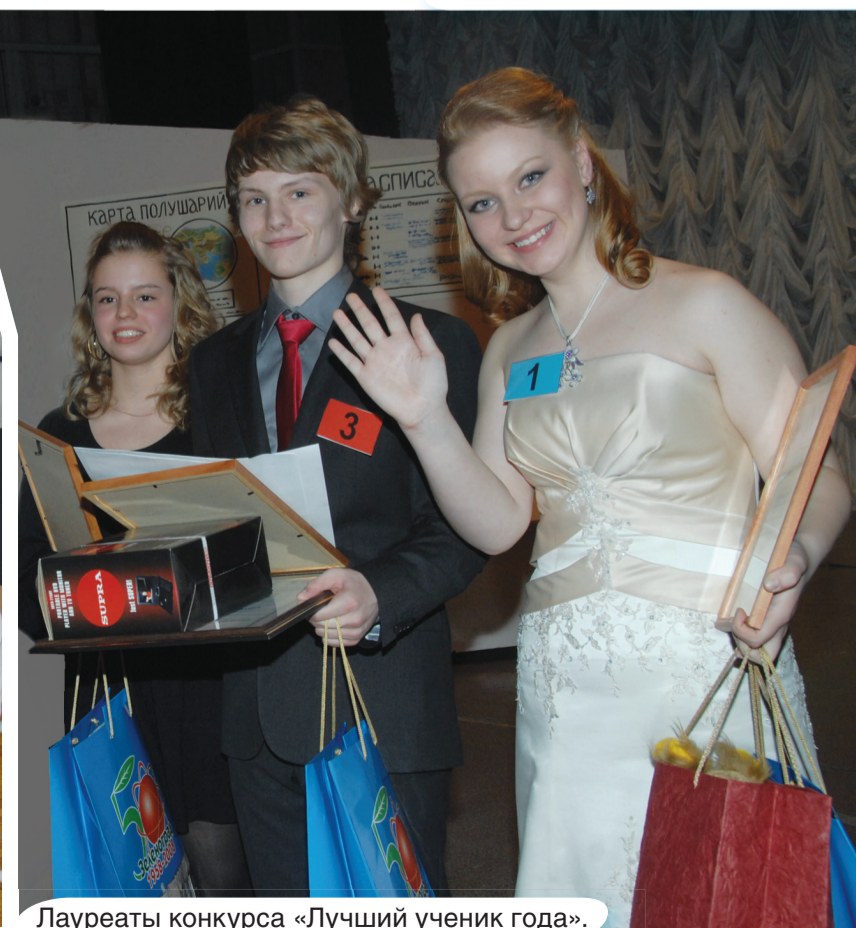
Лауреаты конкурса «Лучший ученик года».