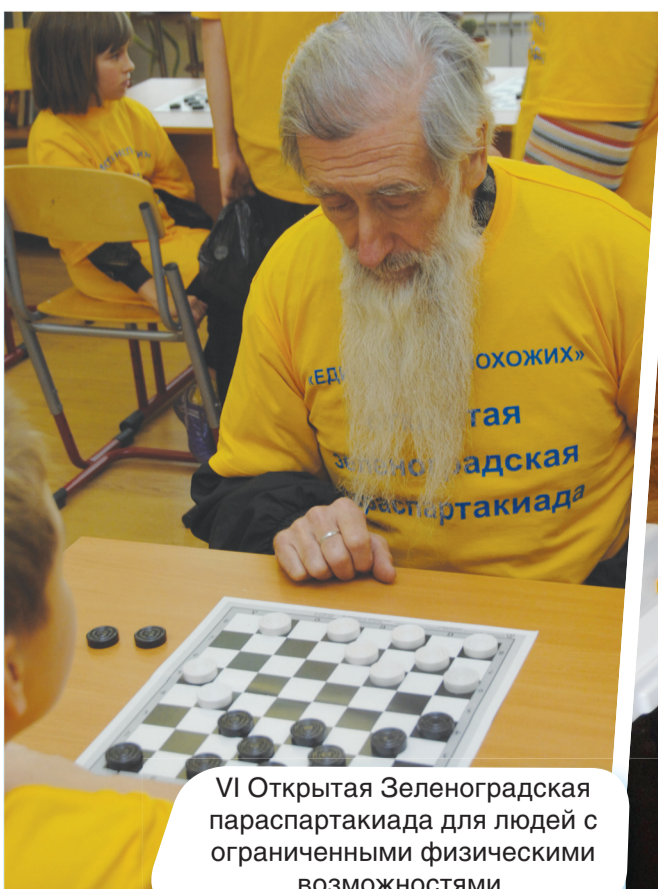
VI Открытая Зеленоградская параспартакиада для людей с ограниченными физическими возможностями.