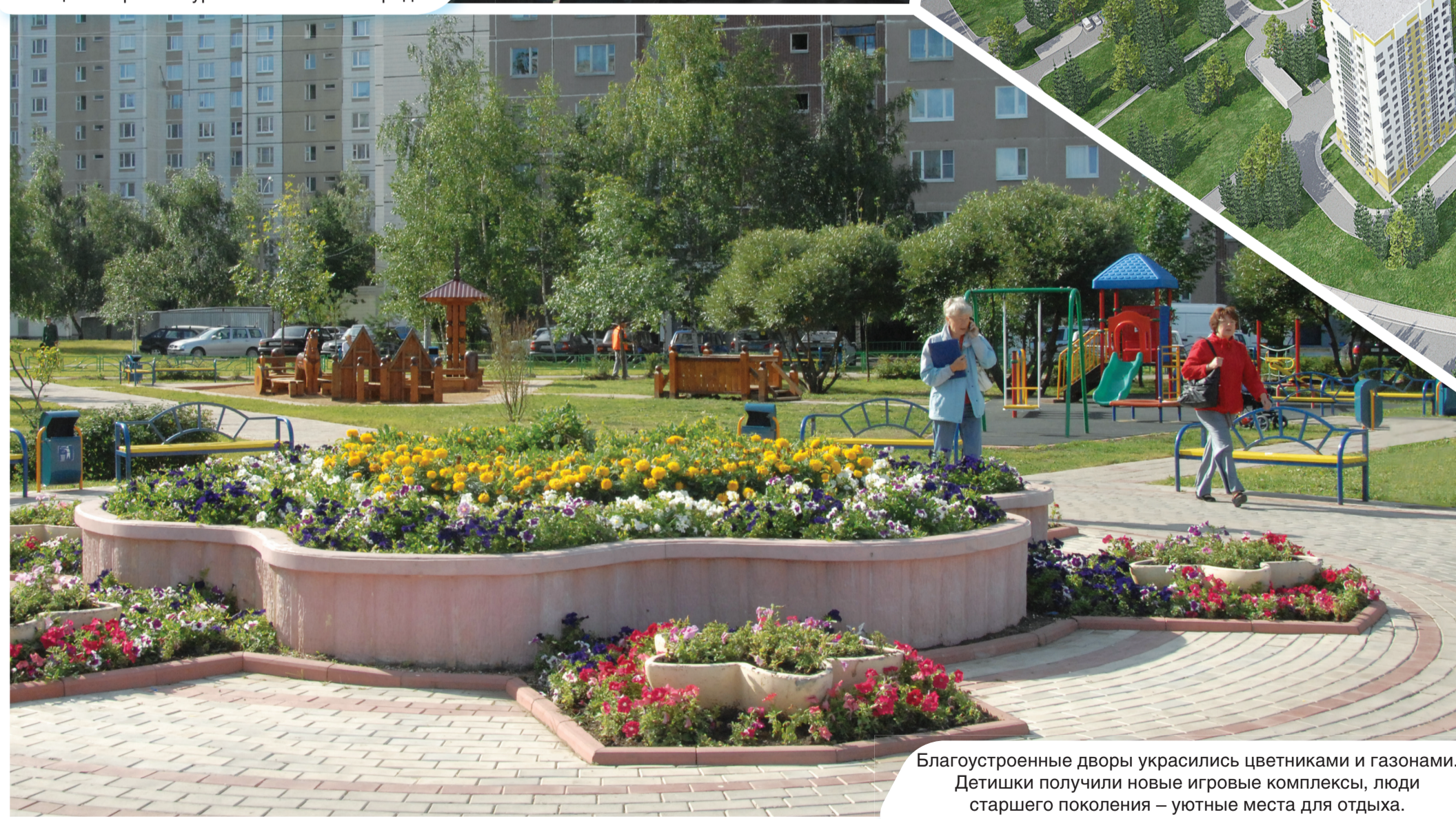
Благоустроенные дворы украсились цветниками и газонами. Детишки получили новые игровые комплексы, люди старшего поколения – уютные места для отдыха.