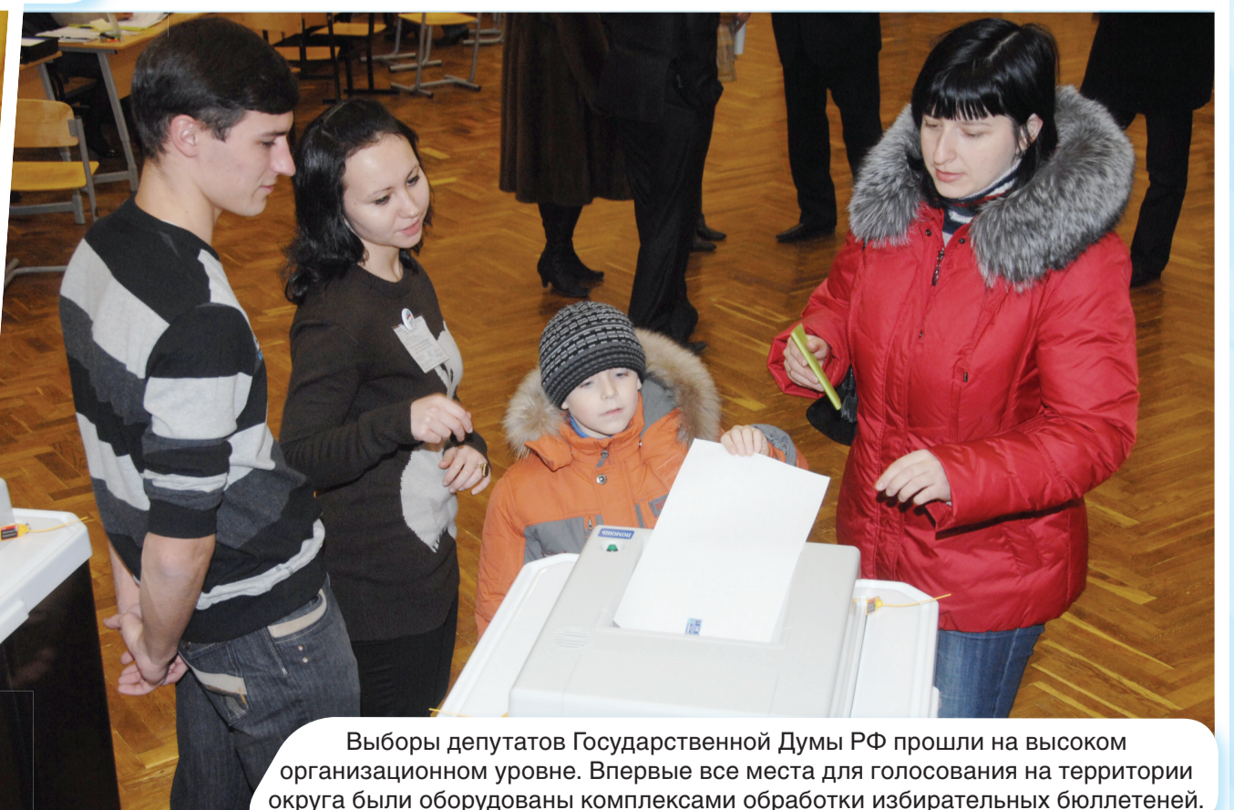
Выборы депутатов Государственной Думы РФ прошли на высоком организационном уровне. Впервые все места для голосования на территории округа были оборудованы комплексами обработки избирательных бюллетеней.