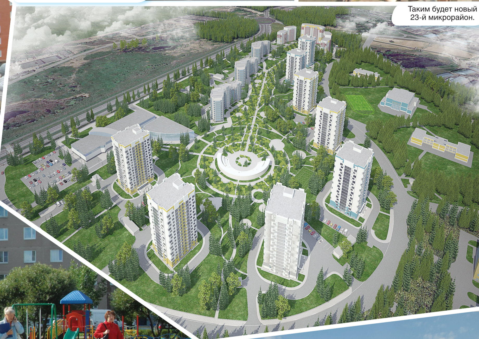
Таким будет новый 23-й микрорайон.