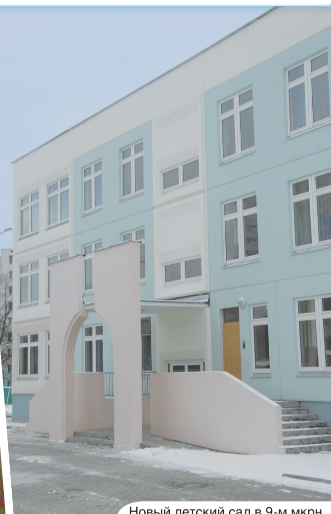
Новый детский сад в 9-м мкрн.

Конкурс профессионального мастерства на «Кубок префекта» среди поваров и кондитеров в Технологическом колледже №49.