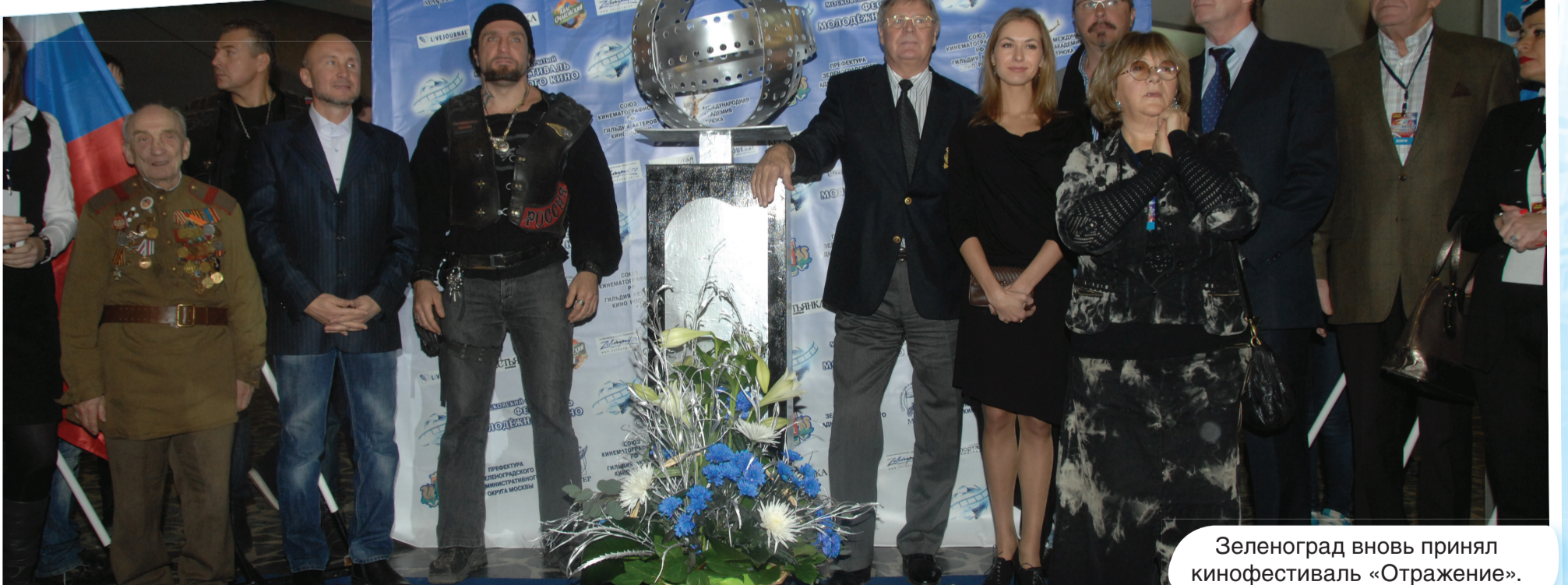
Зеленоград вновь принял кинофестиваль «Отражение».