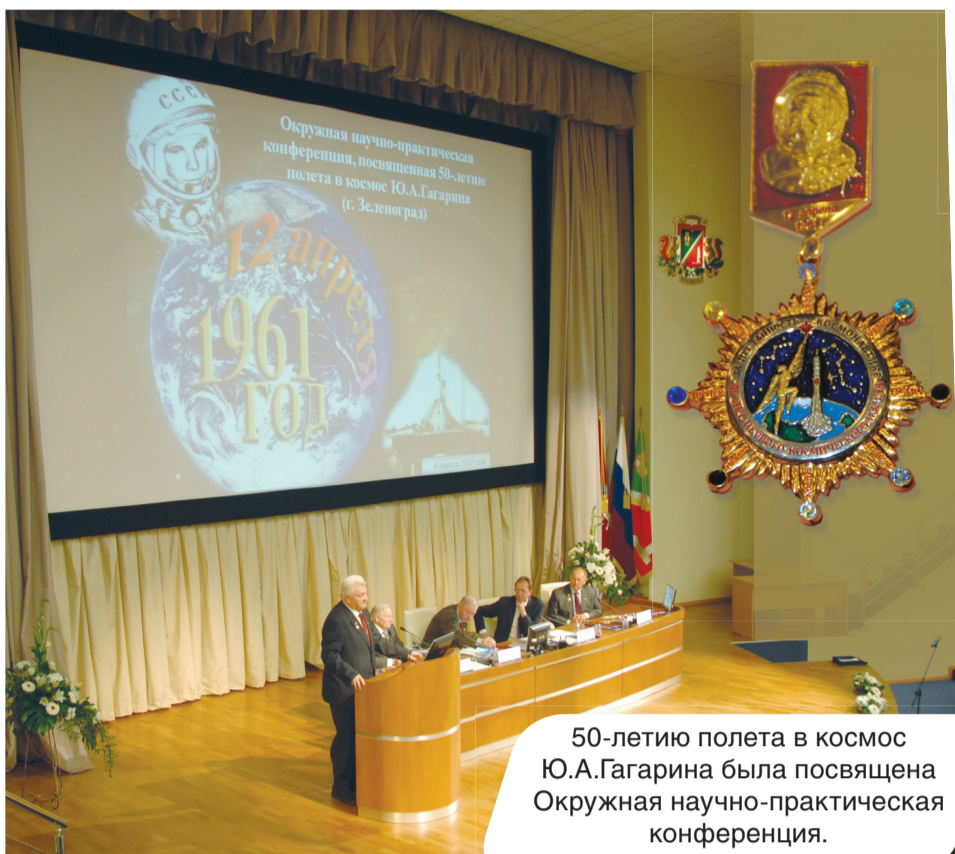
50-летию полета в космос Ю.А.Гагарина была посвящена Окружная научно-практическая конференция.

В рамках Дня города Москвы была организована площадка научно-технического творчества молодежи, на которой свои изобретения представили юные зеленоградцы.