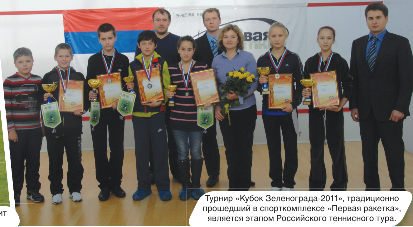
Турнир «Кубок Зеленограда-2011», традиционно прошедший в спорткомплексе «Первая ракетка», является этапом Российского теннисного тура.