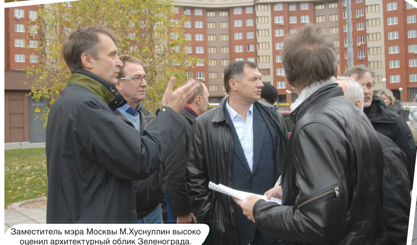
Заместитель мэра Москвы М.Хуснуллин высоко оценил архитектурный облик Зеленограда.