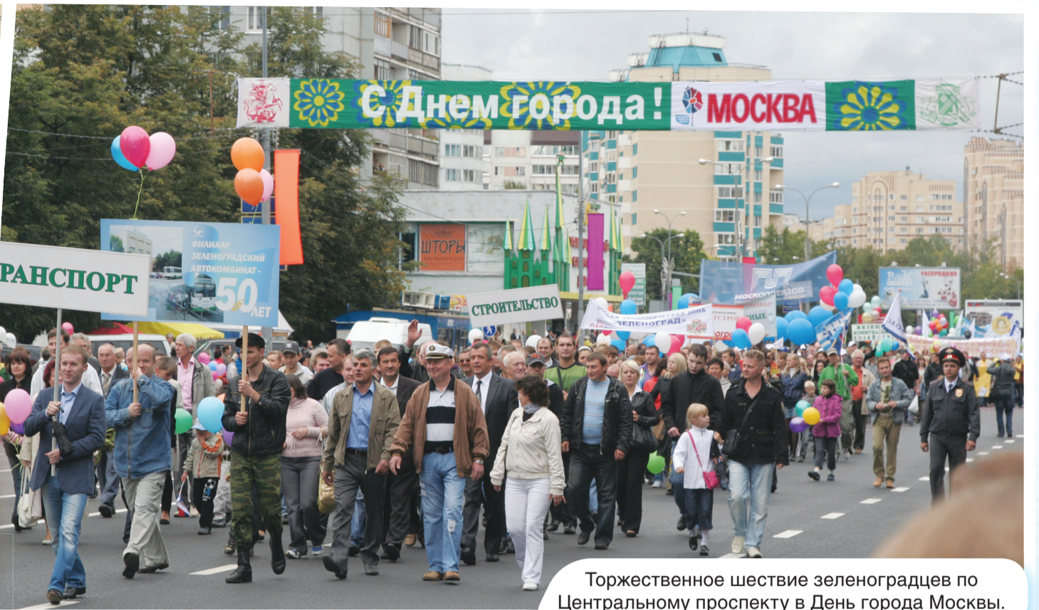
Торжественное шествие зеленоградцев по Центральному проспекту в День города Москвы.