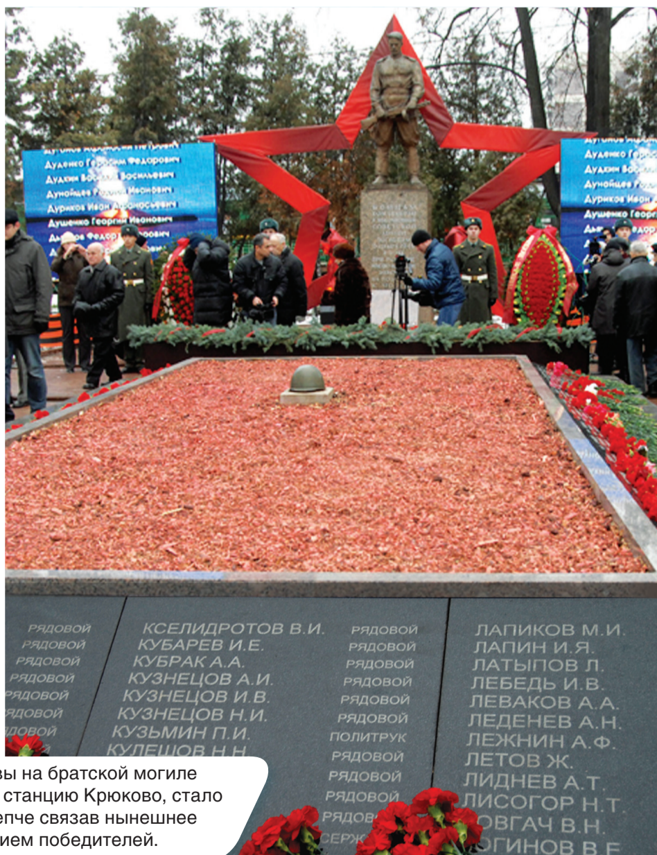
Увековечение памяти защитников Москвы на братской могиле воинов Красной армии, погибших в боях за станцию Крюково, стало символом исторической памяти, еще крепче связав нынешнее поколение зеленоградцев с поколением победителей.