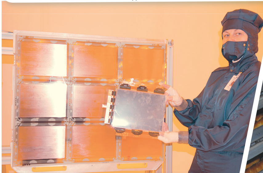
В ОЭЗ «Зеленоград» появился еще один резидент – компания ЗАО «Пластик-Лоджик» – «дочка» мирового лидера в области производства гибких пластиковых дисплеев нового поколения Plastic Logic.