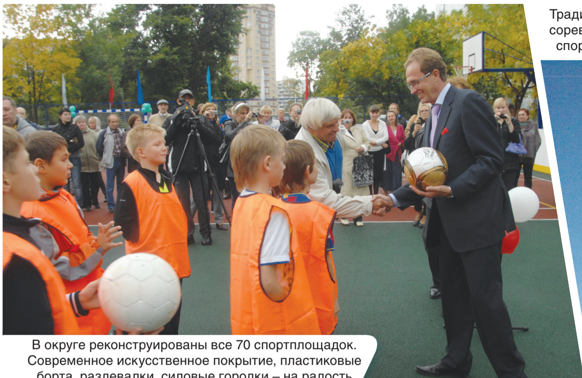
В округе реконструированы все 70 спортплощадок. Современное искусственное покрытие, пластиковые борта, раздевалки, силовые городки – на радость спортивной детворе.