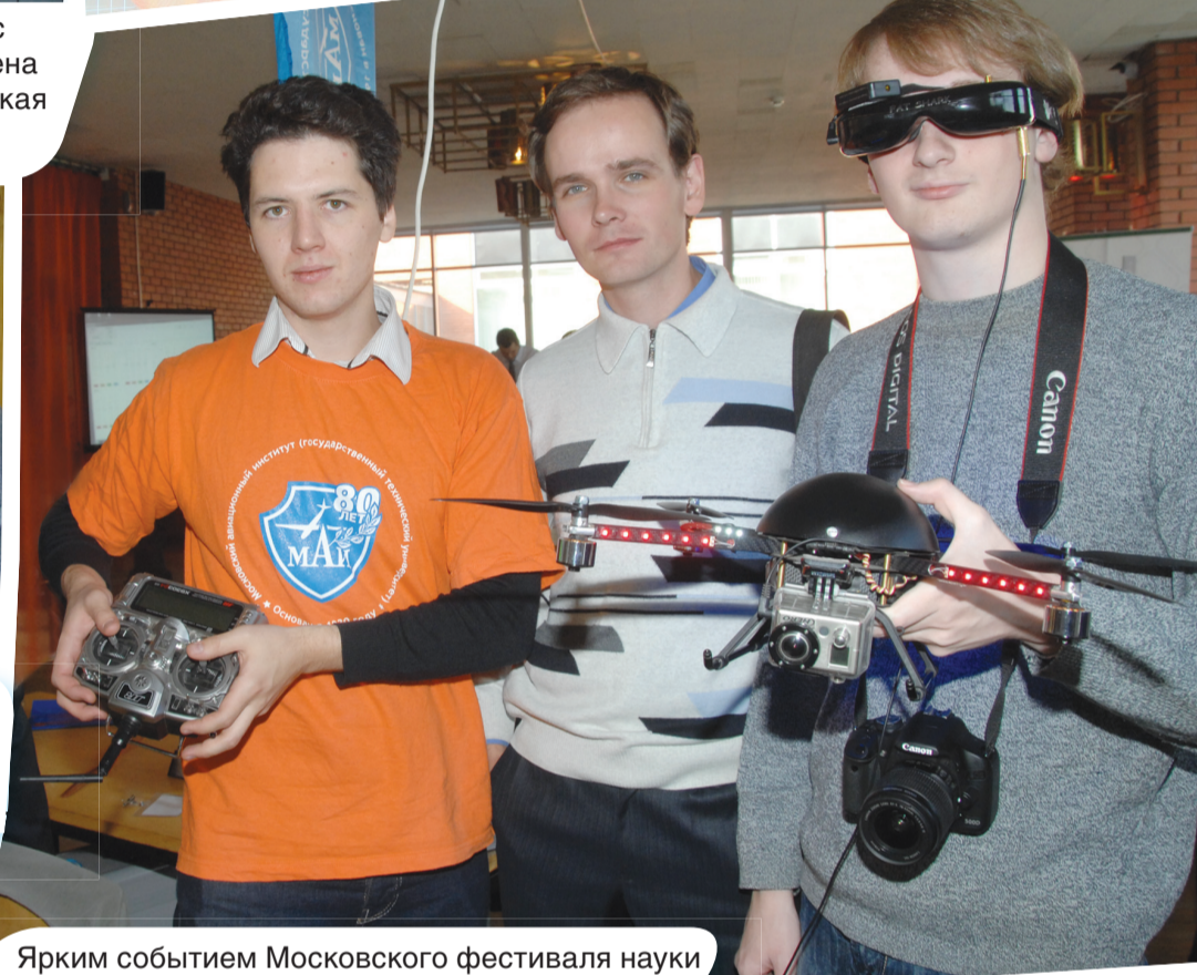
Ярким событием Московского фестиваля науки стала ярмарка «РИТМ Зеленограда».