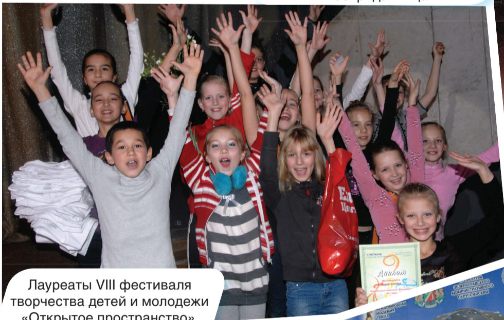
Лауреаты VIII фестиваля творчества детей и молодежи «Открытое пространство».