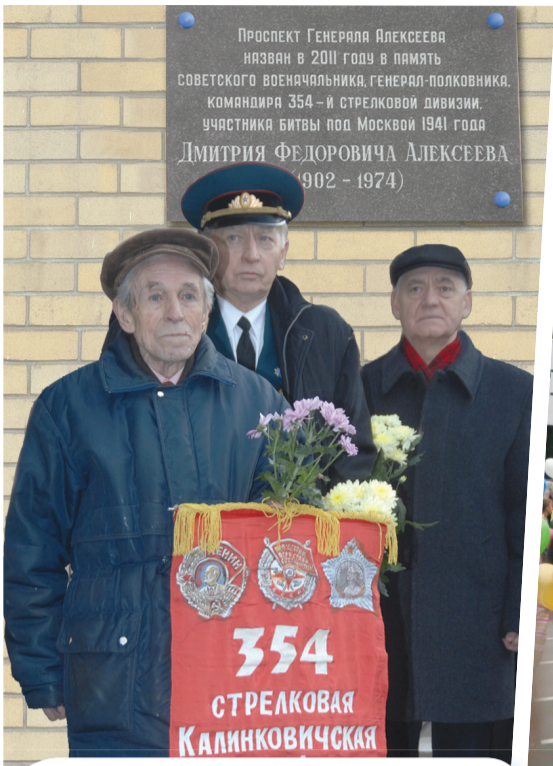
В честь участника битвы за Москву генерал-полковника Д.Алексеева назван проспект и открыта мемориальная доска.