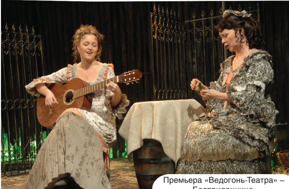
Премьера «Ведогонь-Театра» – «Бесприданница».