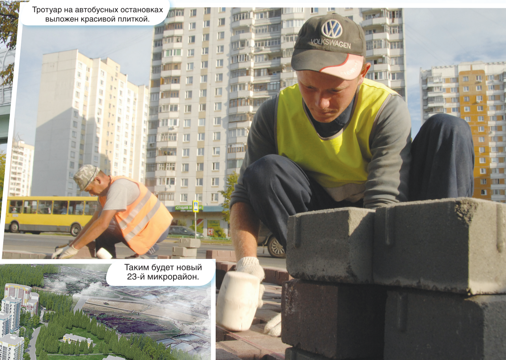
Тротуар на автобусных остановках выложен красивой плиткой.