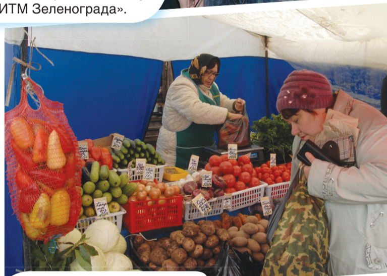
На ярмарке выходного дня.