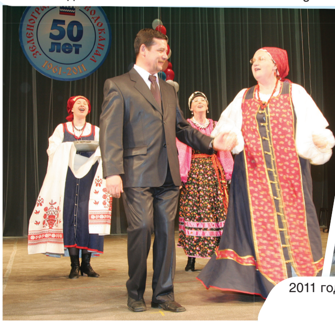
2011 год стал юбилейным для «Зеленоградводоканала», «Хлебозавода №28» и «Зеленоградского автокомбината».