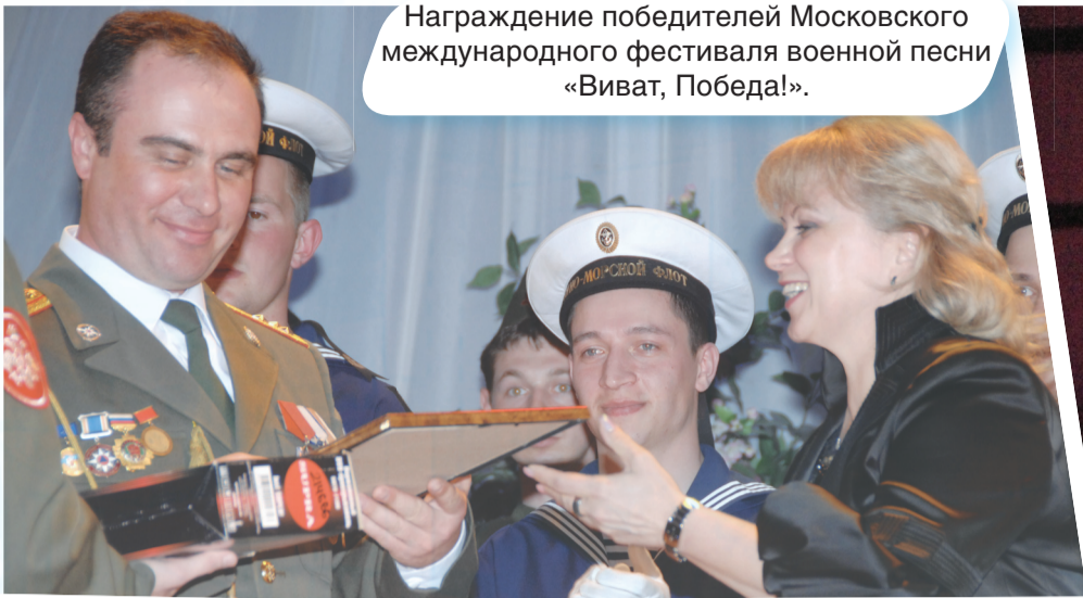
Награждение победителей Московского международного фестиваля военной песни «Виват, Победа!».