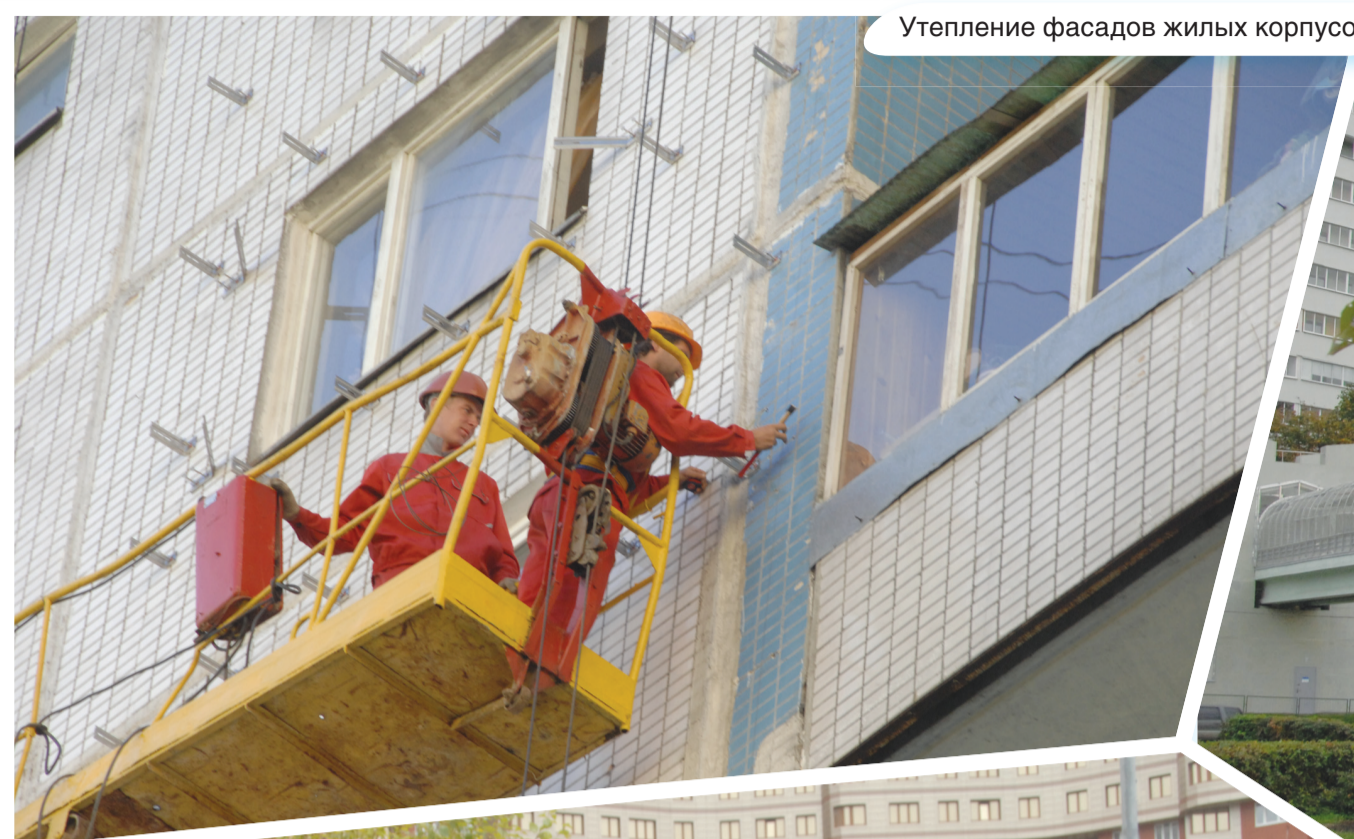
Утепление фасадов жилых корпусов.