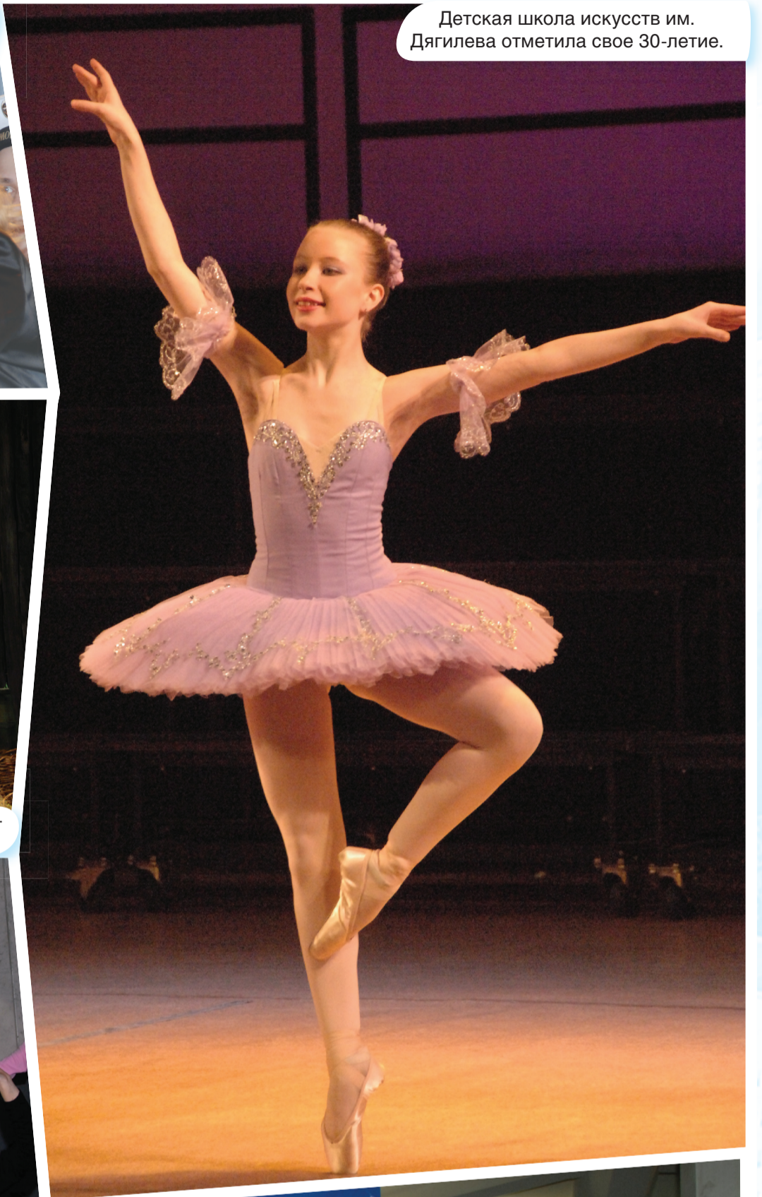
Детская школа искусств им. Дягилева отметила свое 30-летие.