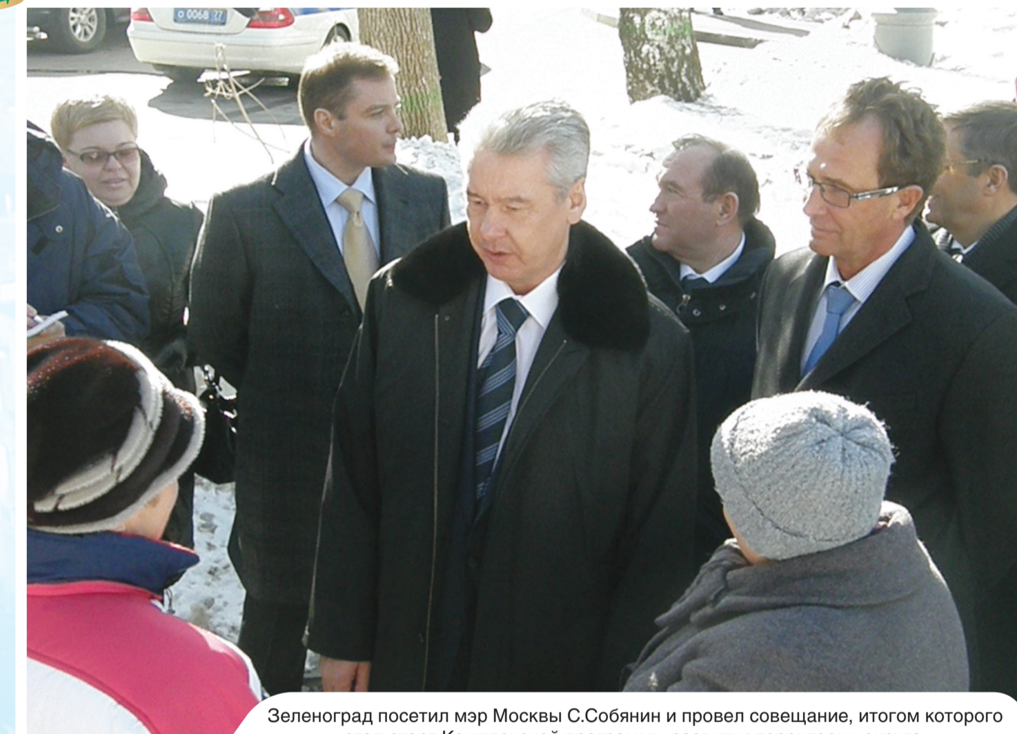
Зеленоград посетил мэр Москвы С.Собянин и провел совещание, итогом которого стал старт Комплексной программы развития территории округа.

Но главным событием уходящего года для столицы и особенно для Зеленограда стало празднование 70-летия великой битвы под Москвой. Это сражение Великой Отечествен-