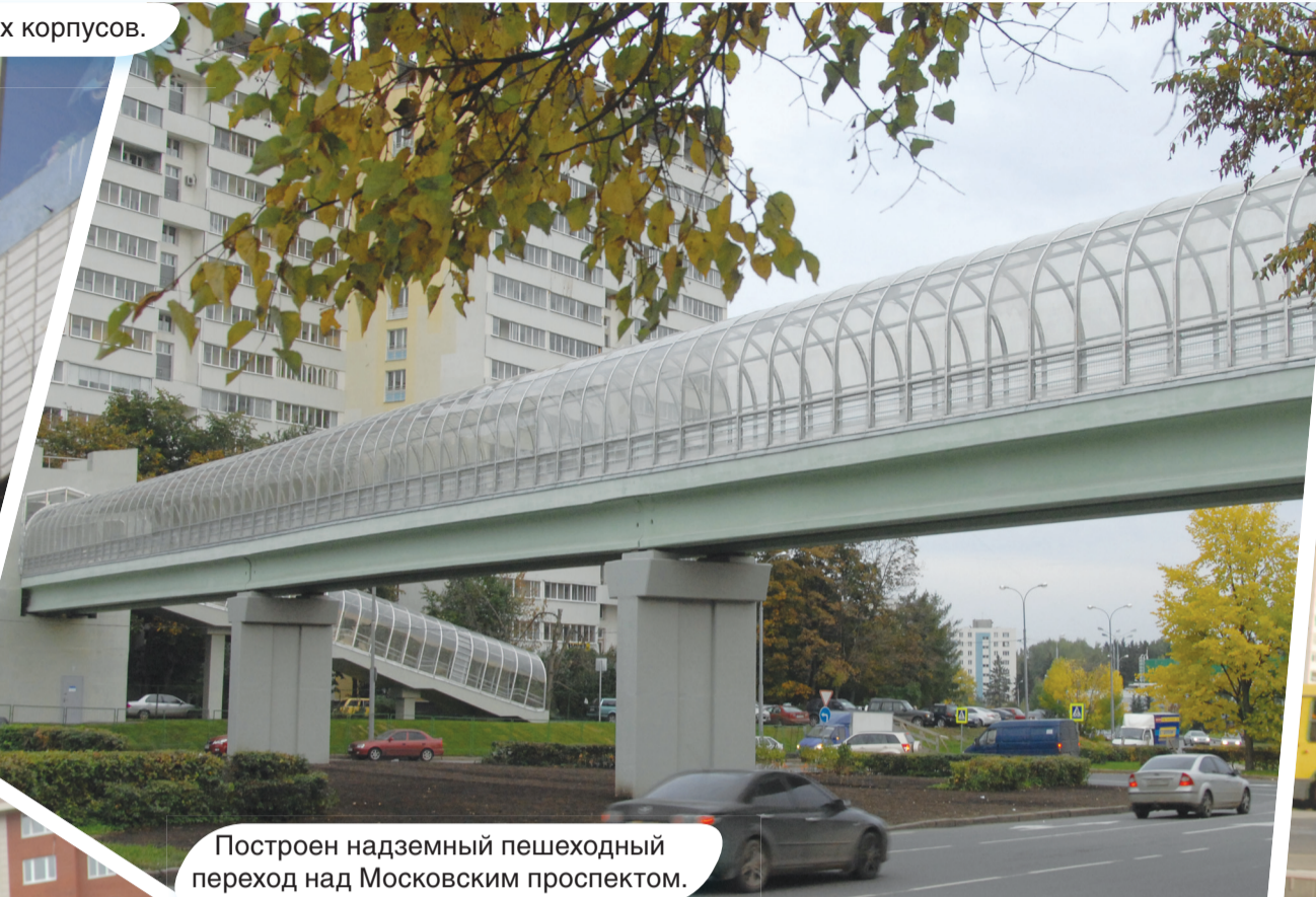
Построен надземный пешеходный переход над Московским проспектом.