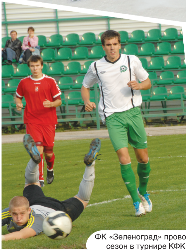
ФК «Зеленоград» проводит сезон в турнире КФК.