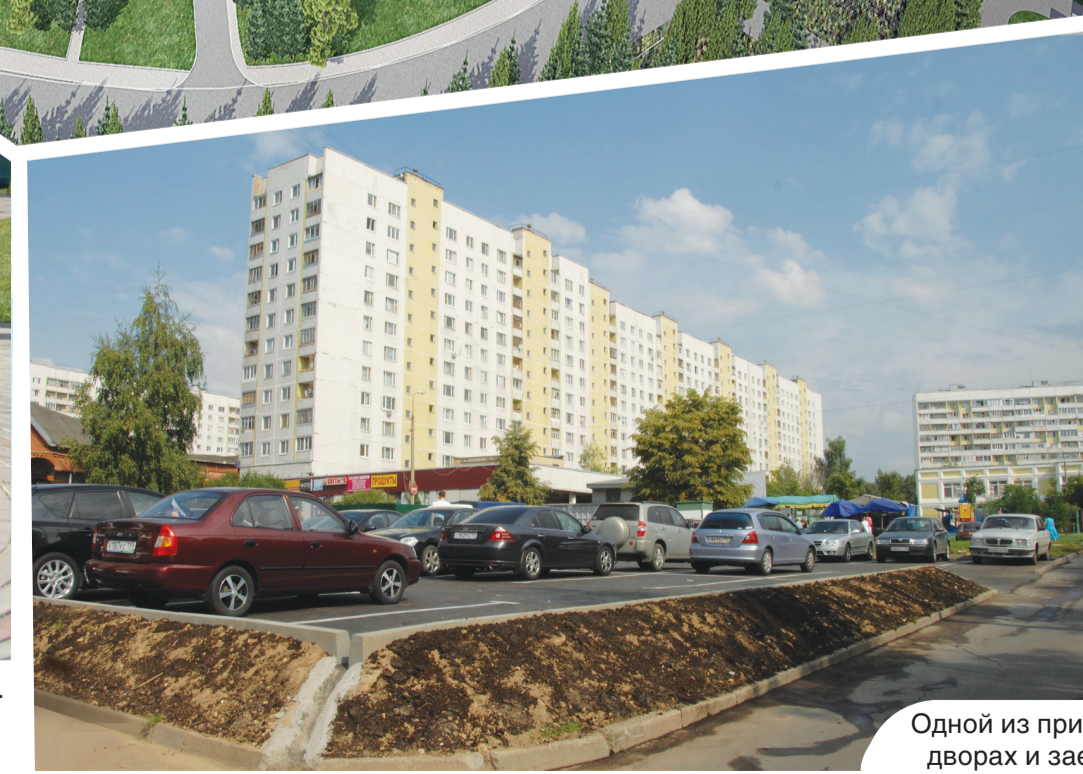
Одной из приоритетных задач стало создание новых парковочных мест во дворах и заездных карманов на остановках общественного транспорта.