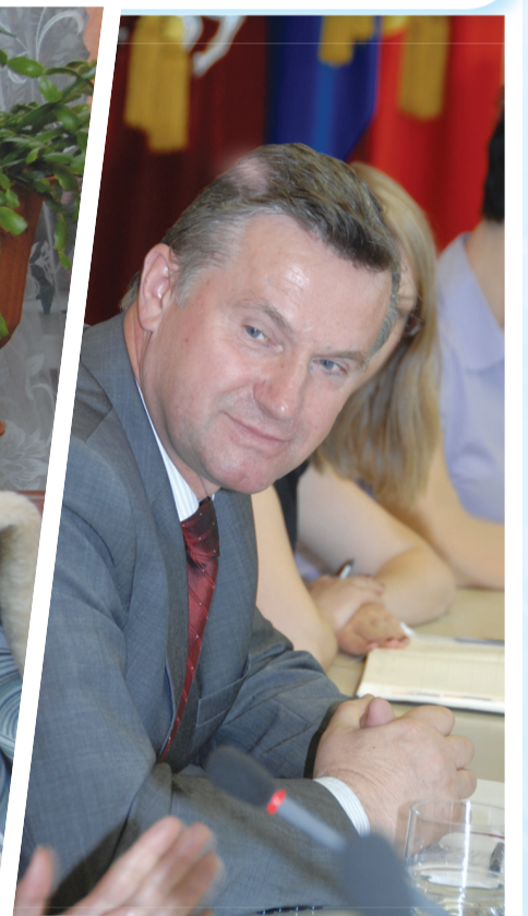
Ширятся международные связи Зеленограда. В рамках 3-го Форума регионов России и Польши наш округ посетила польская делегация.