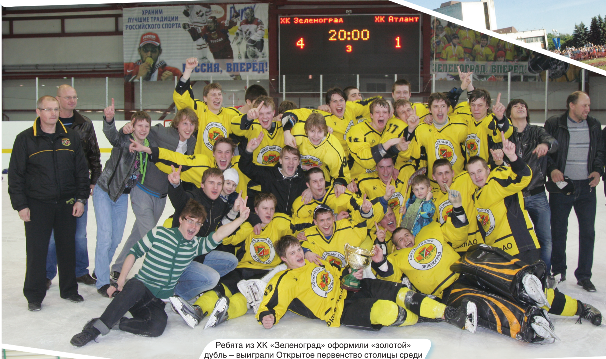
Ребята из ХК «Зеленоград» оформили «золотой» дубль – выиграли Открытое первенство столицы среди молодежных команд и завоевали Кубок Москвы.