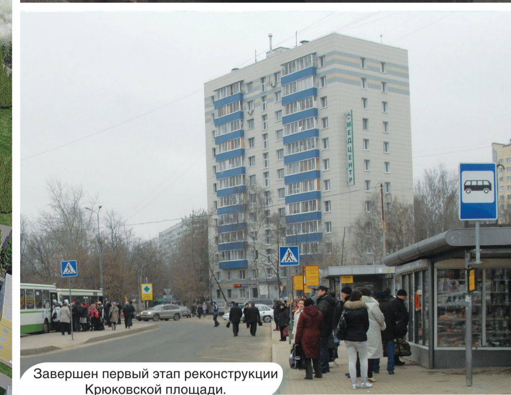
Завершен первый этап реконструкции Крюковской площади.