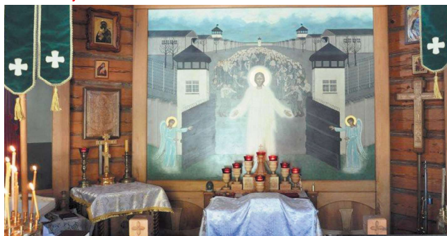
Свято-Воскресенская часовня на территории бывшего лагеря Дахау. Была построена в 1995 г. в память 50-летия победы над Германией и освобождения концлагеря. Алтарный образ часовни уникален: икона «Христос освобождает узников Дахау»