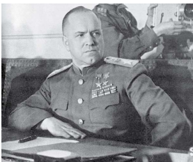
Маршал Г.К. Жуков во время подписания Акта о безоговорочной капитуляции Германии