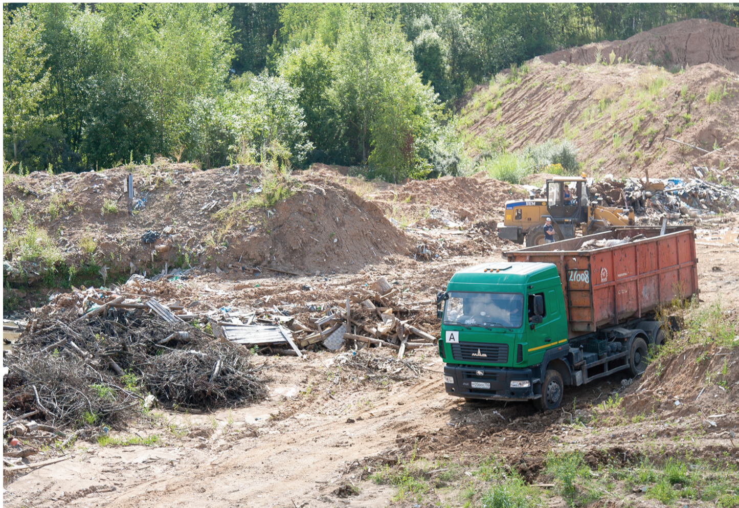
Читайте на стр. 2

Заканчивается ликвидация незаконной свалки у деревни Мошницы