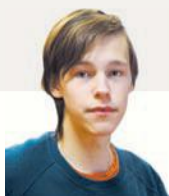
БЛОГЕР САША КУЗЬМИН