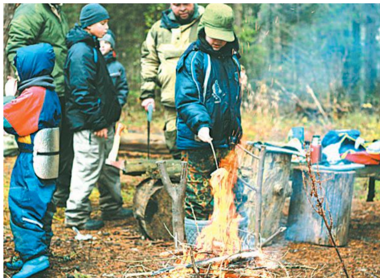
Первый поход духовно-патриотического клуба в ноябре 2018 года.