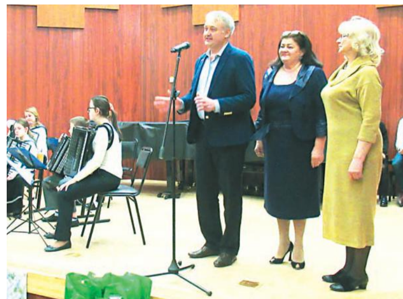
Участники выступили – гости довольны.

– В Череповце служил мой отец, – объясняет свой выбор