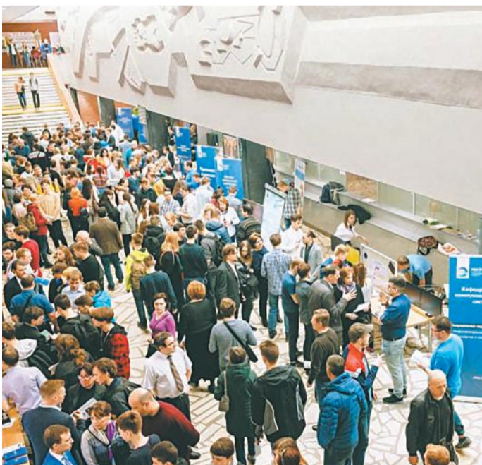
В связи с приближением приемной кампании интерес со стороны абитуриентов к МИЭТу заметно возрос.

Следующий День открытых дверей состоится осенью.