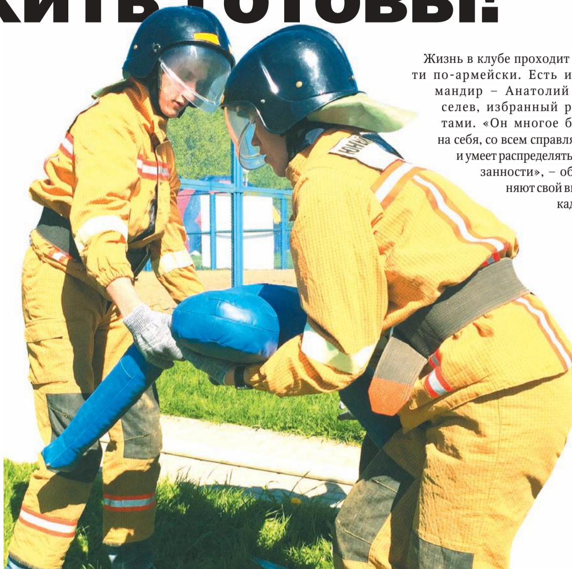
Учащиеся школы №1692 на соревнованиях.

В этом году молодые ратники «Алексеевской дружины» собираются посетить Ржевский район