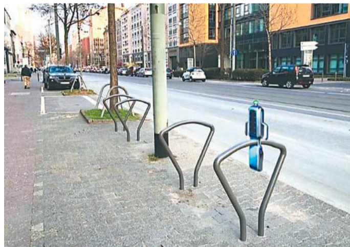
Более подробную информацию вы можете узнать на сайте zelenograd.ctpark.ru .

Пилотный запуск запланирован на конец июня 2019 года. Ожидаемый срок реализации проекта – два года.