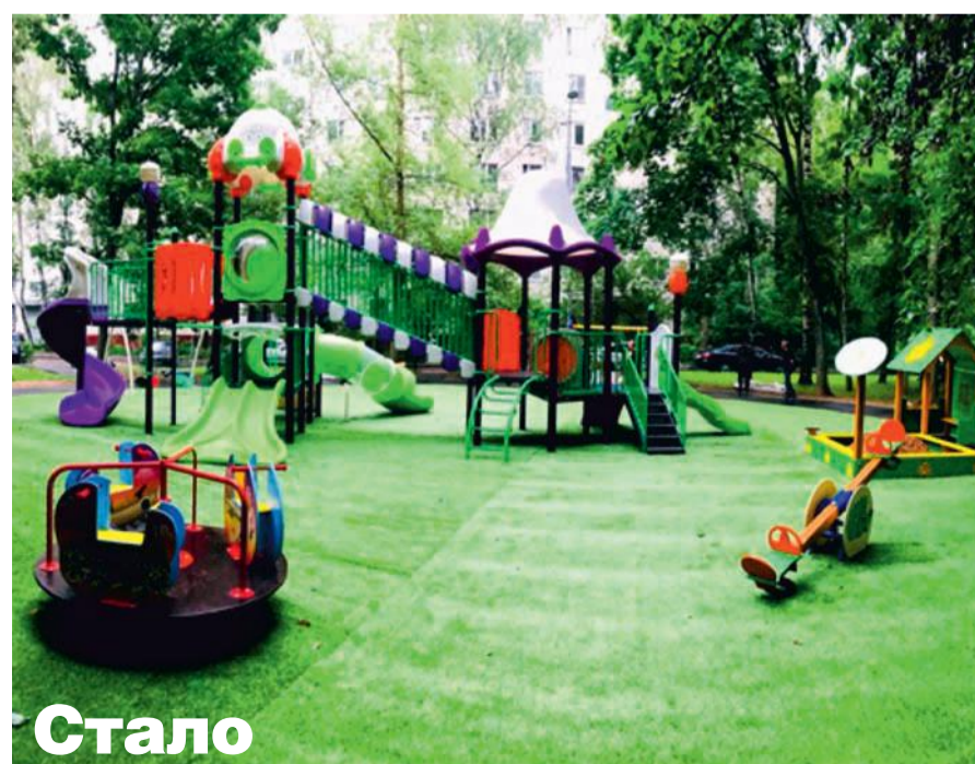
Детская площадка у корп. 447.