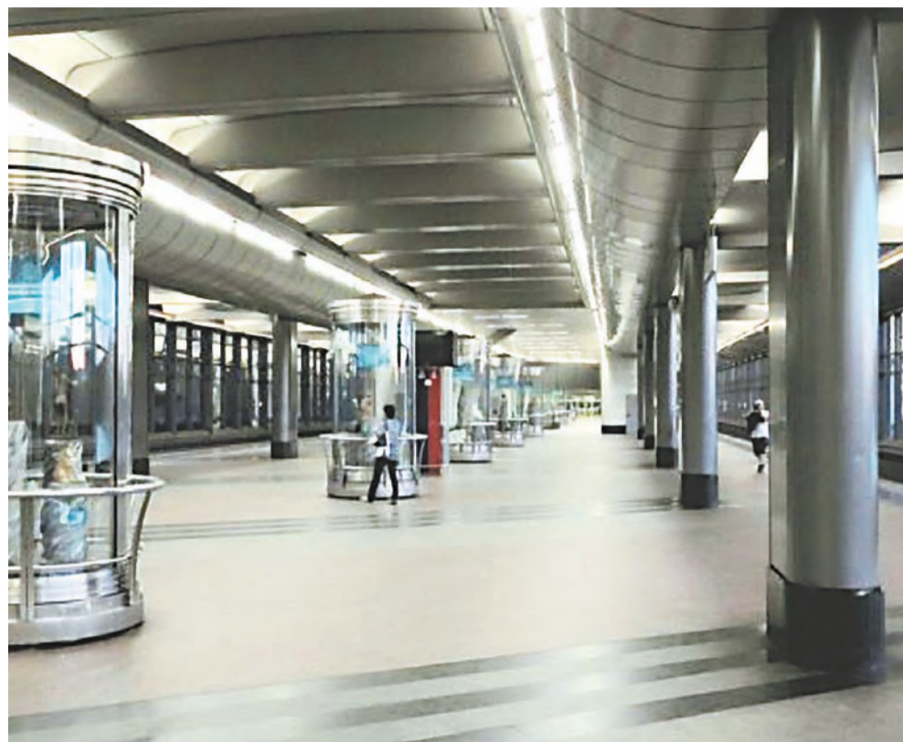
В 2018 году выполнены работы по 46 объектам столичного метрополитена.