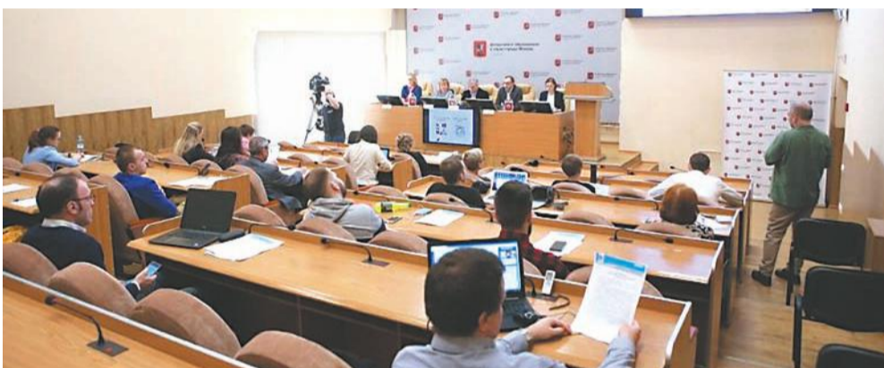
101 магистерская программа открыта в эту приемную кампанию в МГПУ

■ Мы живем в информационном обществе, и технологические изменения вокруг нас лавинообразны. В наши дни, пользуясь небывалыми по прежним временам опциями новейших технологий, молодежь осваивает все новые компетенции, о которых пару десятилетий назад можно было разве что прочитать в фантастических романах.