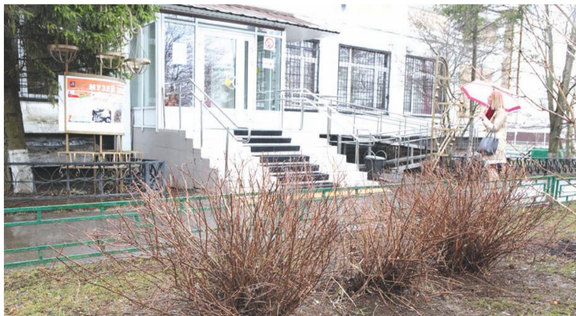
Выполнена санитарная обрезка ветвей кустарников у корп. 1410.

– В период месячника благоустройства (в апреле) спортивные площадки будут отремонтированы.