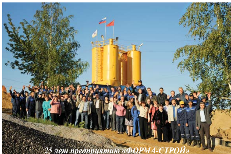
25 лет предприятию «ФОРМА-СТРОЙ»

■ И.БАБАЯН