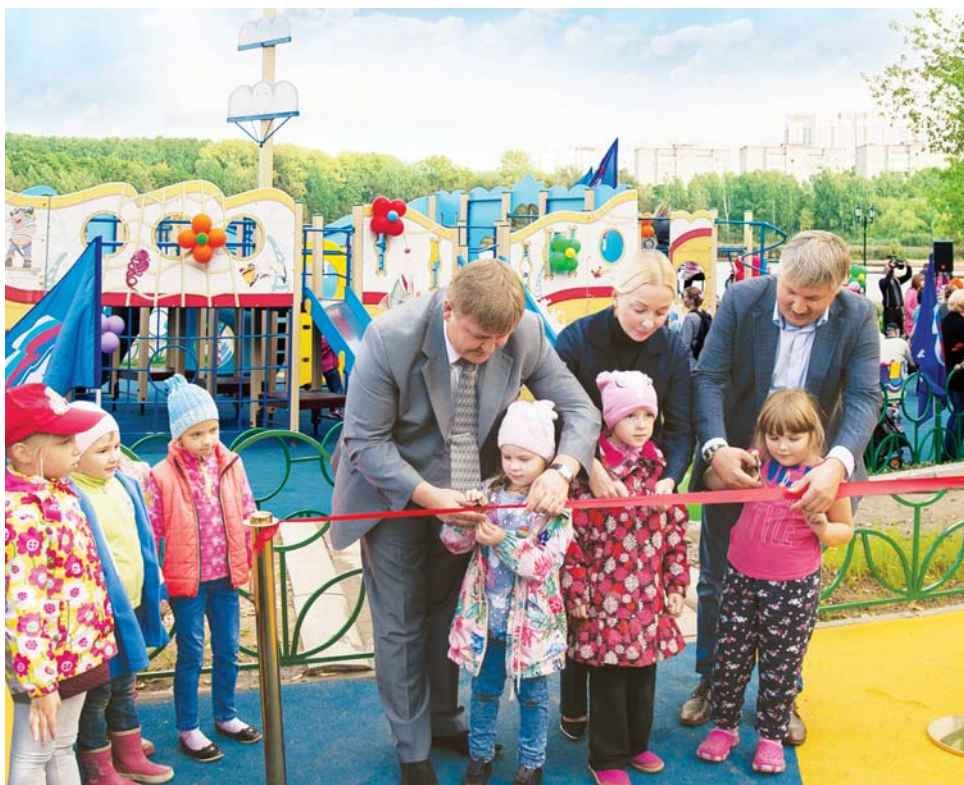
Читайте на стр. 2

Детские игровые комплексы открыты в Кривцово, Смирновке и Солнечногорске