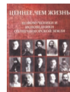
Обложка из книги «Ценнее, чем жизнь».

Страдания за Христа претерпев, веру Православную сохранил еси и, терпением гонители Церкви Русския посрамив, благочестно в законе Господни пожил еси, исповедниче славне Илие, престолу Божию предстои, моли спастися душа нашим.